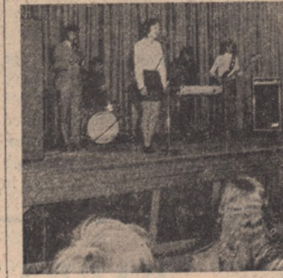
DEKLIŠKI ZBOR IN INSTRUMENTALISTI

Solidnost teh mladinskih koncertov je plemenitenje umetnostnega okusa in hrana duha. Izpričuje kulturno zavest pri mladini, estetska težnja, fizični