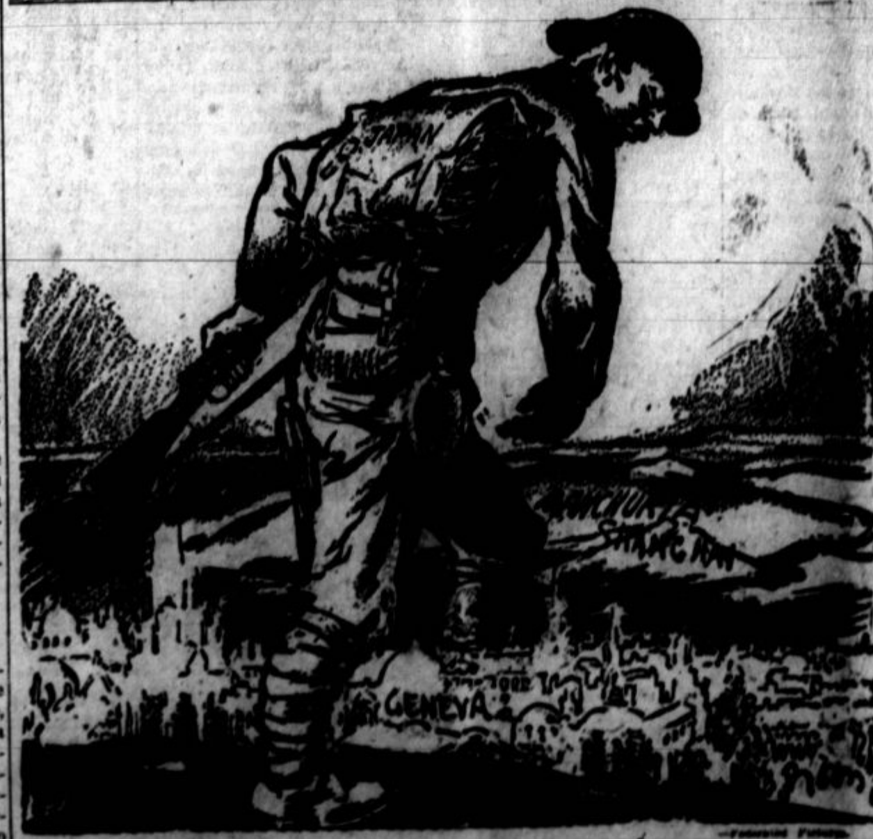
Zajezili je Ženevo...

Rio de Janeiro, Brazilija, 21. marca.—Vlada predsednika Vargasa je naznanila, da bo skušala poravnati politične diference z voditelji uporne gibanja na jugu, da tako prepreči odcepitev. Neka druga vest se glasi, da bo predsednik Vargas, ki se je s silo povzpel na krmilo vlade pred dvema letoma, podal resignacijo. pošilja v belo sužnost v Južno in Centralno Ameriko.