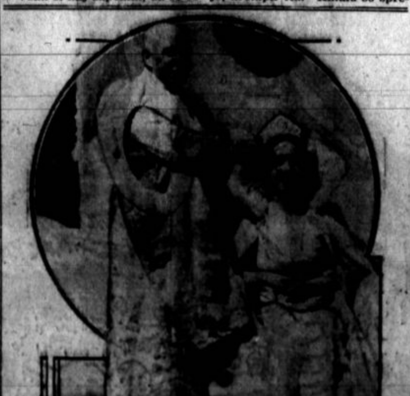
Californijski governor James Rolph je odlični svoj odisej glede Toma Mooneyja, že še ostane v leti ali so, ker ima "premnalo časa" za proučevanje evidence. Ta slika pa kaže, da ima Rolph dosti časa za "kromanje lepote krajinice."