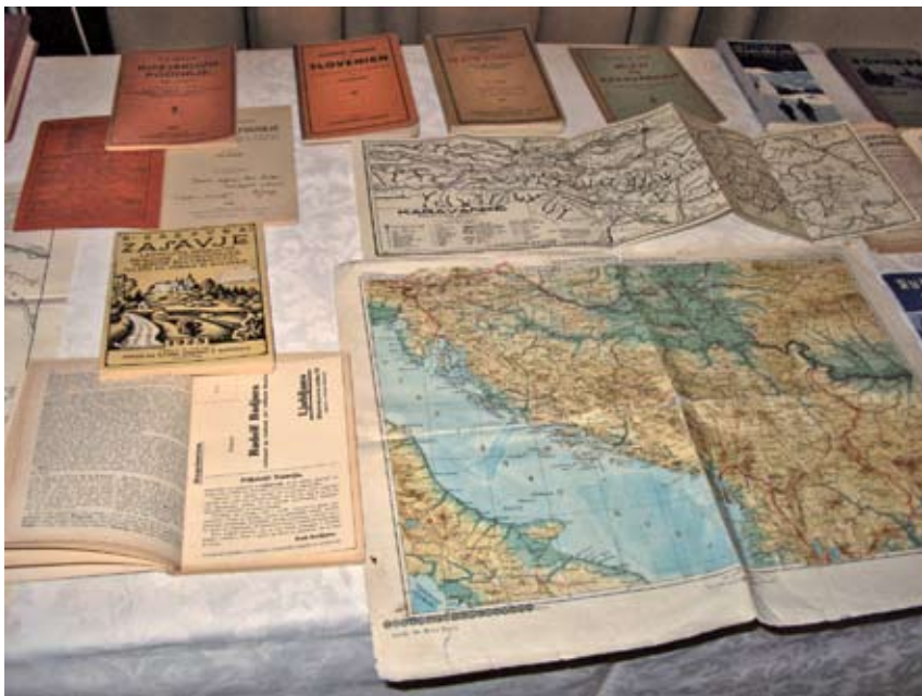
Del Badjurovega publicističnega opusa, foto: Herman Berčič

Badjura se je navduševal bolj nad nordijsko-alpisko tehniko, s katero se je seznanil na vojaških smučarskih tečajih pred prvo svetovno vojno. Kot navaja avtor, je vsa svoja takratna znanja, spoznanja in izkušnje s smučarskih terenov strnil v knjigo oz. smučarski priručnik Smučar . Bil je prvi, ki je na slovenskem govornem področju pripravil izčrpen smučarski vodnik, v katerem je sis-