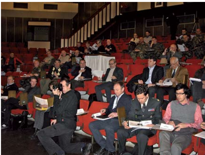
Avditorij v Poljčah z referenti, foto: Herman Berčič