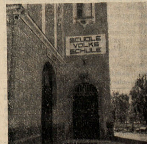
Na vseh javnih poslopijih Južne Tirolske so dvojezični napisi

Na splošno je tudi poljedelstvo visoko razvito, prekaša po uporabi umetnih gnojil večino italijanskih pokrajin ter je opremljeno z najnovejšimi pridobitvami kmetijske tehnike. Enoosni gorski traktorji, motorne kosilnice in brizgalne srečaš lahko do najvišjih gorskih kmetij, prav tako pa je opaziti povsod moderna zbirna gnojlišča ter tudi na visokih strmih pobočjih namakanje travnikov in pašnikov s pomočjo modernih namakalnih na-