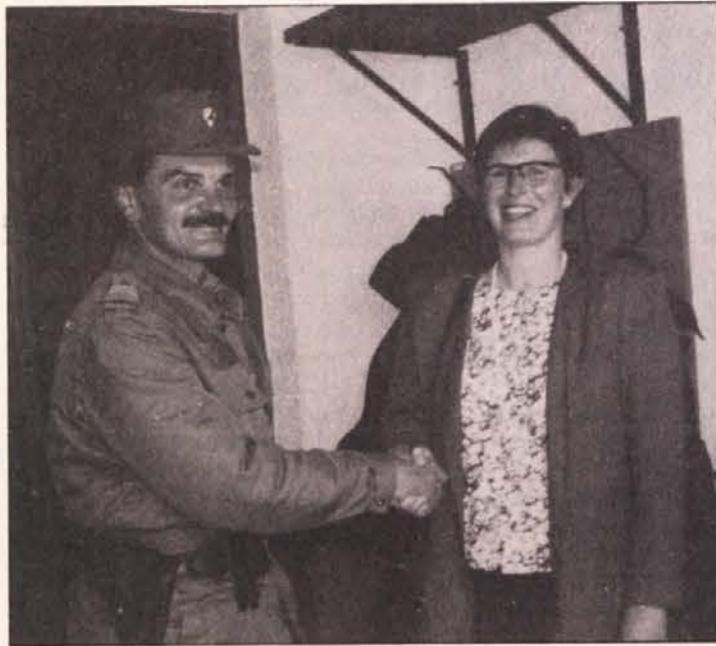
Poslanka Zelene alternative v avstrijskem parlamentu mag. Terezija Stoisic se je v zadnjih dneh osebno prepričala o stanju na avstrijsko-slovenski meji. Posnetek je z mejnega prehoda Jezersko, kjer je avstrijsko parlamentarko pozdravil komandant enote teritorialne obrambe.

5. Die KSZE und die EG werden aufgefordert, sofort internationale Beobachter zu entsenden, welche instand sein müssen, die Einhaltung des Waffenstillstandes und die Beachtung der zwischen der Belgrader Regierung und den Republiken Slowenien und Kroatien getroffenen Vereinbarungen zu garantieren.