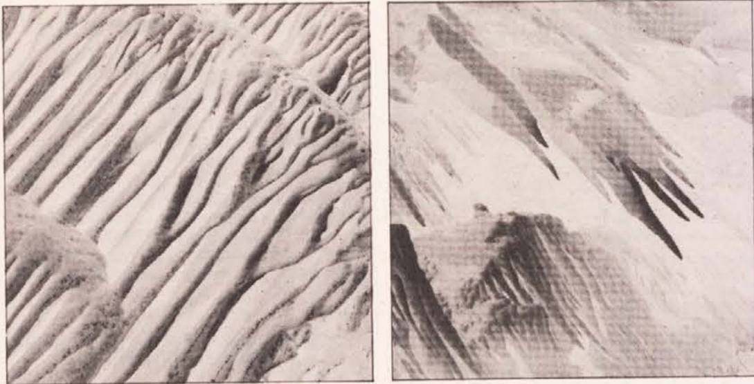
Jame v Obirju, pravi čudež narave, si je ogledalo že preko 10.000 obiskovalcev.