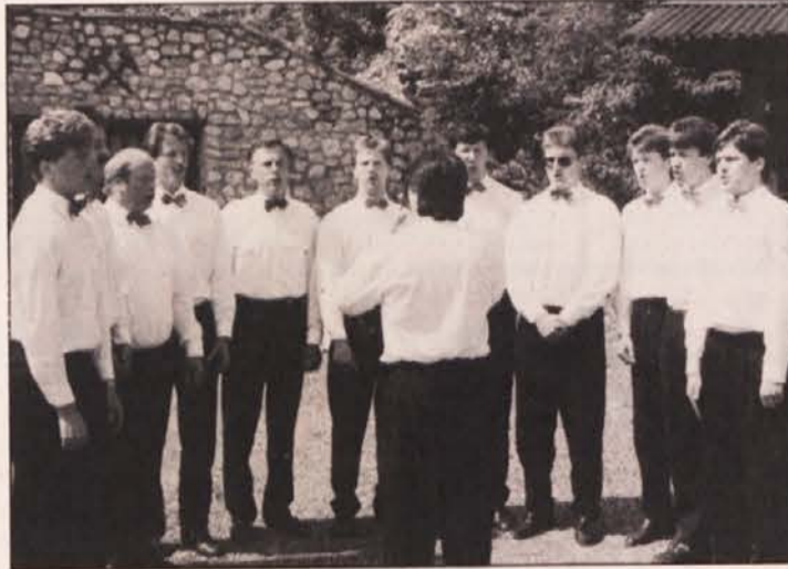
Pri otvoritvi je zapel tudi MoPZ „Val. Polanšek“.