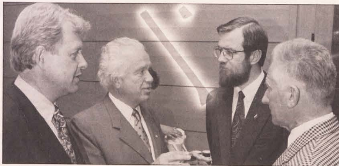
Izrednega zasedanja Delovne skupnosti Alpe-Jadran pretekli teden v Celovcu se je kljub napetim razmeram v Sloveniji udeležil tudi šef slovenske vlade Lojze Peterle.

Predsednik slovenske vlade Lojze Peterle se je ob pri-liki svojega bivanja na Koroškem (zasedanje DS Alpe-Jadran) posebej zahvalil Zvezi slovenskih organizacij na Koroškem ter Narodnemu svetu koroških Slovencev za njuno hitro pomoč državljanom Slovenije. Kot je znano, so obe osrednji organizaciji ter tudi druge slovenske ustanove na Koroškem pozvale k pomoči.