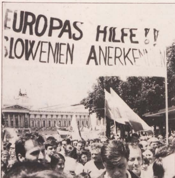
Protesti proti vojaški agresiji jugoslovanske armade se nadaljujejo po vsej Evropi. Pretekli teden je nekaj sto demonstrantov na Dunaju zahtevalo takojšnjo prekinitev ognja v Sloveniji in se solidariziralo s stremljenjem slovenskega in hrvaškega naroda po neodvisnosti in suverenosti.

V okviru postopka o izključitvi FPÖ iz LI bo na zatožno klopi poklican tudi sam Haider.