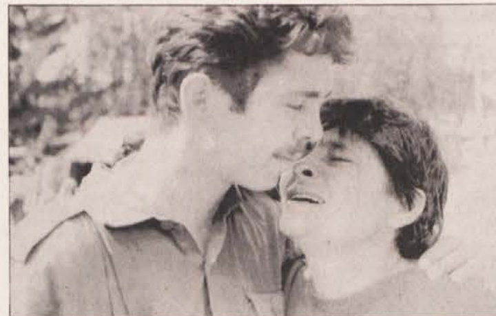
Starši skoraj 3000 slovenskih vojakov, ki služijo vojaški rok v jugoslovanski armadi, odločno zahtevajo vrnitev njihovih sinov v domovino. V Sloveniji pa hkrati prihajajo številčne delegacije staršev srbskih in hrvaških vojakov, da bi zvedeli za usodo svojih sinov. Slika iz Vrhnikke kaže snidenje srbske matere s svojim sinom.