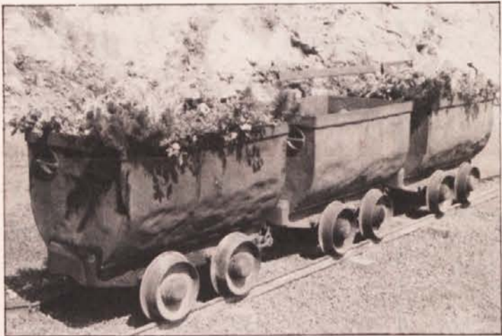
Stari vozički, ostanki iz nekdanjega rudnika.