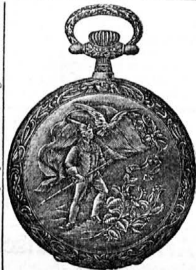
Lastna tovarna ur v Sviči.