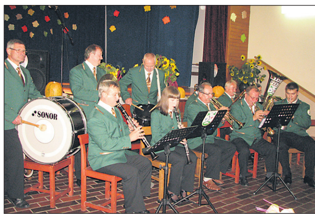
Vaška godba se je predstavila v novih uniformah.