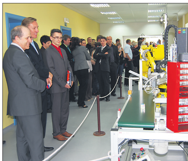
Hiša naprednih tehnologij je zelo sodobna.