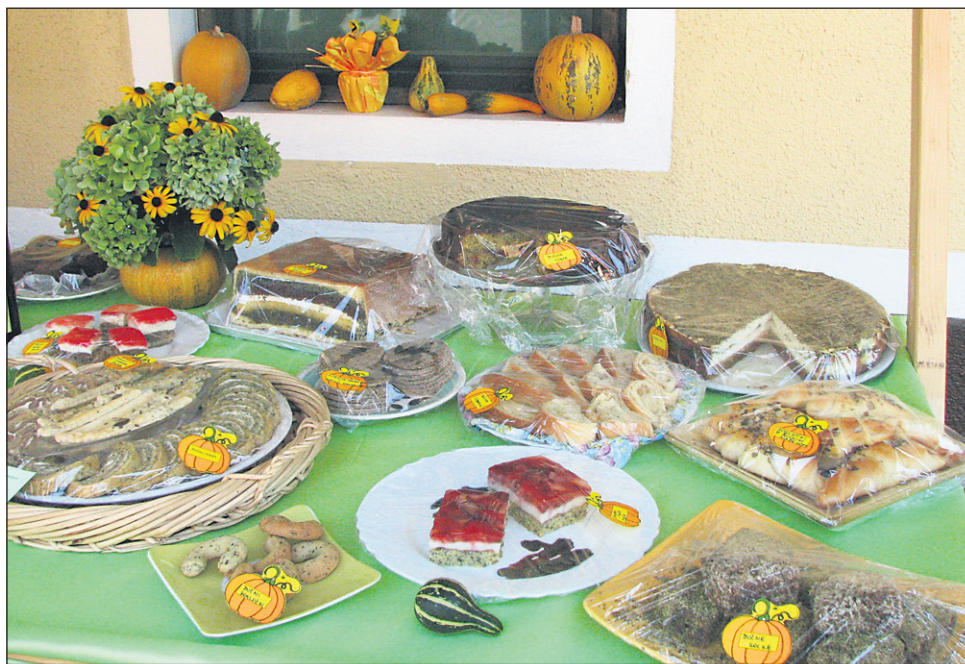
Razstava je bila privlačna kot zmeraj.

Na odru šotora so se zvrstili številni nastopajoči, ki so skrbeli za dobro voljo obiskovalcev. Po prizorišču je vozil tudi turistični vlakec, ogledati pa si je bilo mogoče tudi ponudbo kmetijske mehanizacije. Orga-