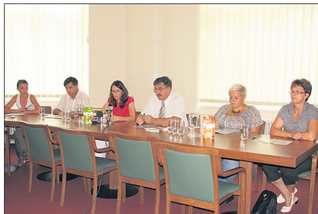
Martinovanje bo letos potekalo predvsem v organizaciji Občine Ormož in Jare s TIC ter ob podpori številnih soorganizatorjev.