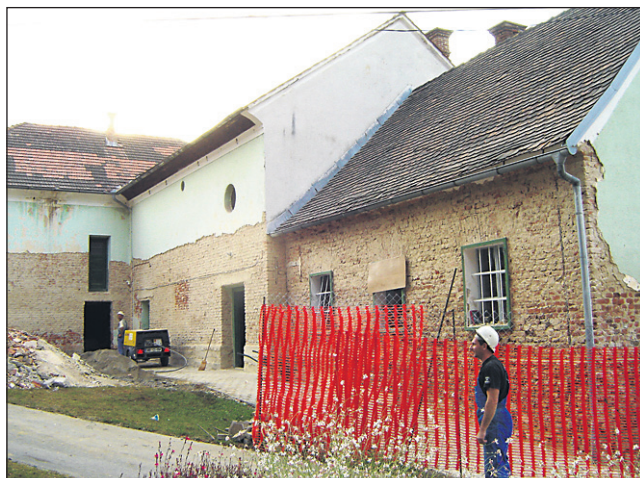
Dela že potekajo.

„Ob gradbenih standardih pa je potreba za ureditev oziroma modernizacijo navedenega odseka tudi v uresničevanju nadaljevanja turističnega razvoja, ko se bo s posegi v ureditev cestne infrastrukture omogočalo lažje migracijske pogoje povezovanja turistično-poslovnih stikov. Turizem kot izrazita interdisciplinarna dejavnost je dejavnik celo-