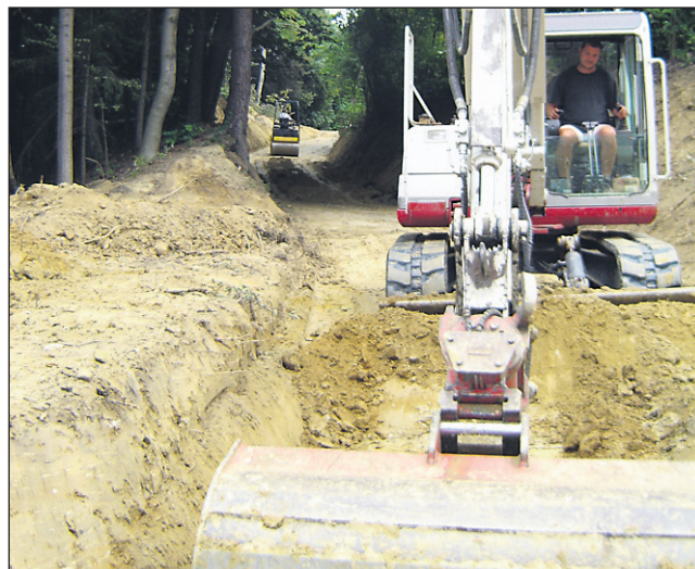
Stroje so že pognali.