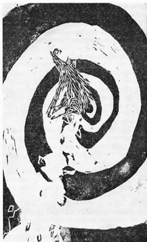
Silvo Kresnik, Spomin na laž