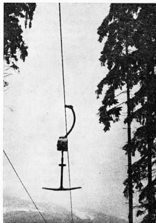
To zimo brez posla

Delegatski sistem v našem DSP še ni zavel. Dnevni red in snov za obravnavo