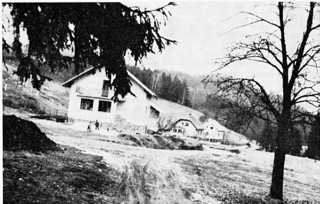
V Podkraju raste v mirnem in čistem okolju novo naselje delavcev

O nagrajevanju po minulem delu smo govorili na naših zadnjih zborih delavcev, ko smo obravnavali in dajali pripombe na »sindikalsko listo 75«. Ko bomo sprejemali dogovor o sindikalni listi, dajemo obenem obvezo, da v našem sporazumu upoštevamo dogovorjena merila. Pri tem velja vedeti, da delež