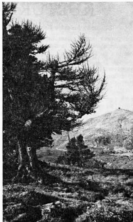
S poti na goro