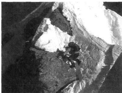
Takole na Hillaryjevi stopnji: če je že kje kaj snega, je vsenaokrog prepadna strmina – in tukaj je bilo treba smučati.

Vršni greben, ki je bil zaradi močnega vetra pokrit z zbitim snegom, je Davo presmučal brez vsakih težav, sledila je Hillaryjeva stopnja, 15-metrski skalni skok, kjer je sicer le redkokdaj sneg, to pot pa ga je bilo bistveno več kot običajno. Na vrhu te stopnje, ki bi bila lahko odločilna za njegovo smučanje več kot 3500 višinskih metrov v globino, se je proti vsem svojim načelom z