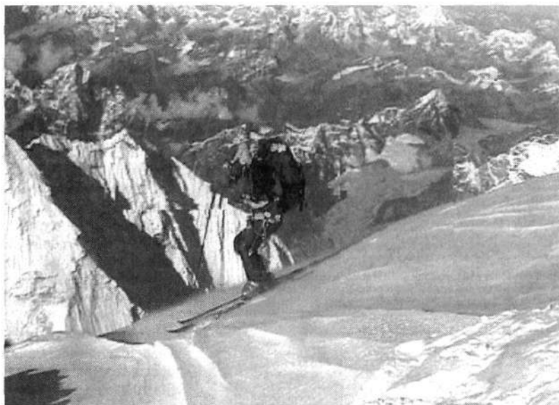
Vsenaokrog sami visoki hribi – vendar je treba gledati večina le pod noge, saj bi pa dec pomenil katastrofo.