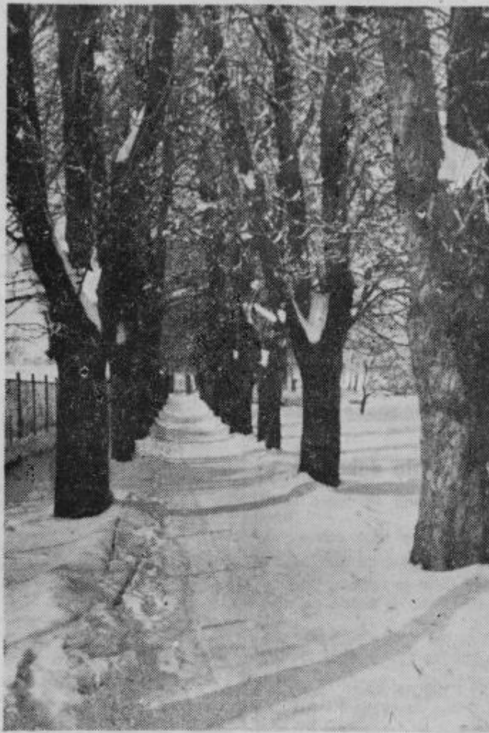
Drvorec proti Ljudskemu vrtu

Kdor pač ne bo hotel samoiniciativno ali na opozorilo opraviti svoje dolžnosti, bo pač moral občutiti posledice, ki jih vsebuje odlok o redu v Ptjuju.