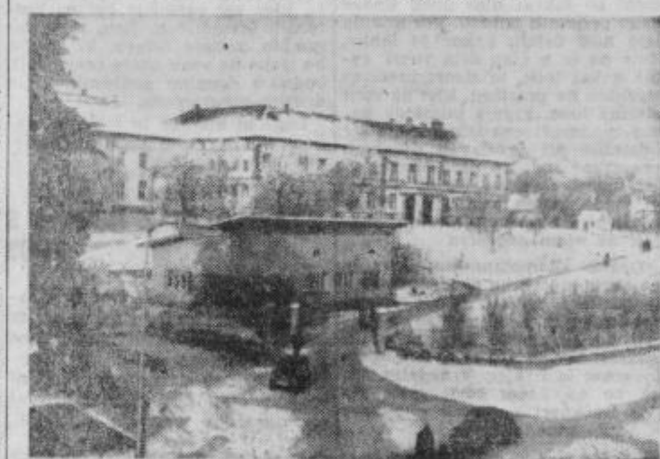
Ptujška bolnišnica je poleti in pozimi polno zasedena

Stalna konferenca mest je predlagala sprejetje novega zakona, ki bi bolje reguliral zaščito pred požari v državi. Udeleženci včerajšnje seje so menili, da bi morali o tem nekoliko več spregovoriti tudi v statutih občin.