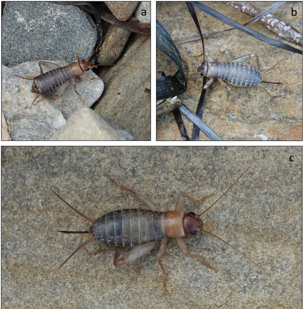
Slika 3. Obalni muren Pseudomogoplistes squamiger : (a) samec, Belvedere, Izola; (b) ličinka, Fiesa, Piran; (c) samica, Belvedere, Izola