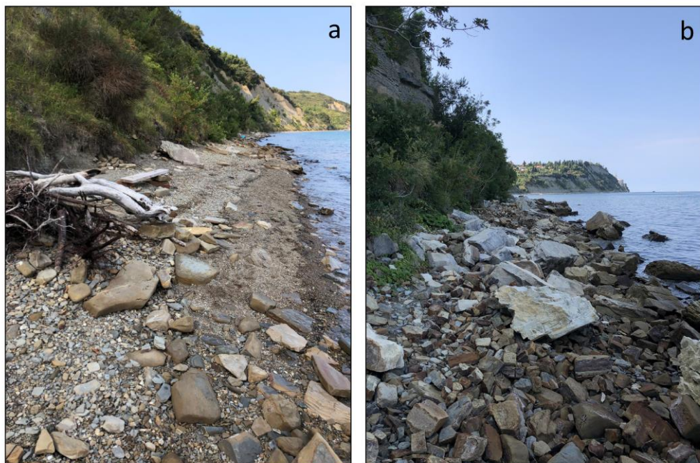
Slika 2. Lokalitete v Slovenski Istri, kjer je bil 25. 9. 2021 opazovan obalni muren Pseudomogoplistes squamiger : (a) morsko nabrežje pod Belvederom pri Izoli, (b) morsko nabrežje v Fiesi pri Piranu