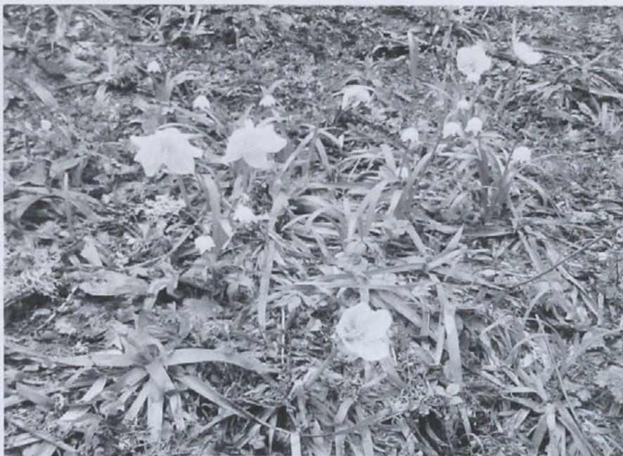
Telohi in zvončki sredi maja izpod Uršlje gore.