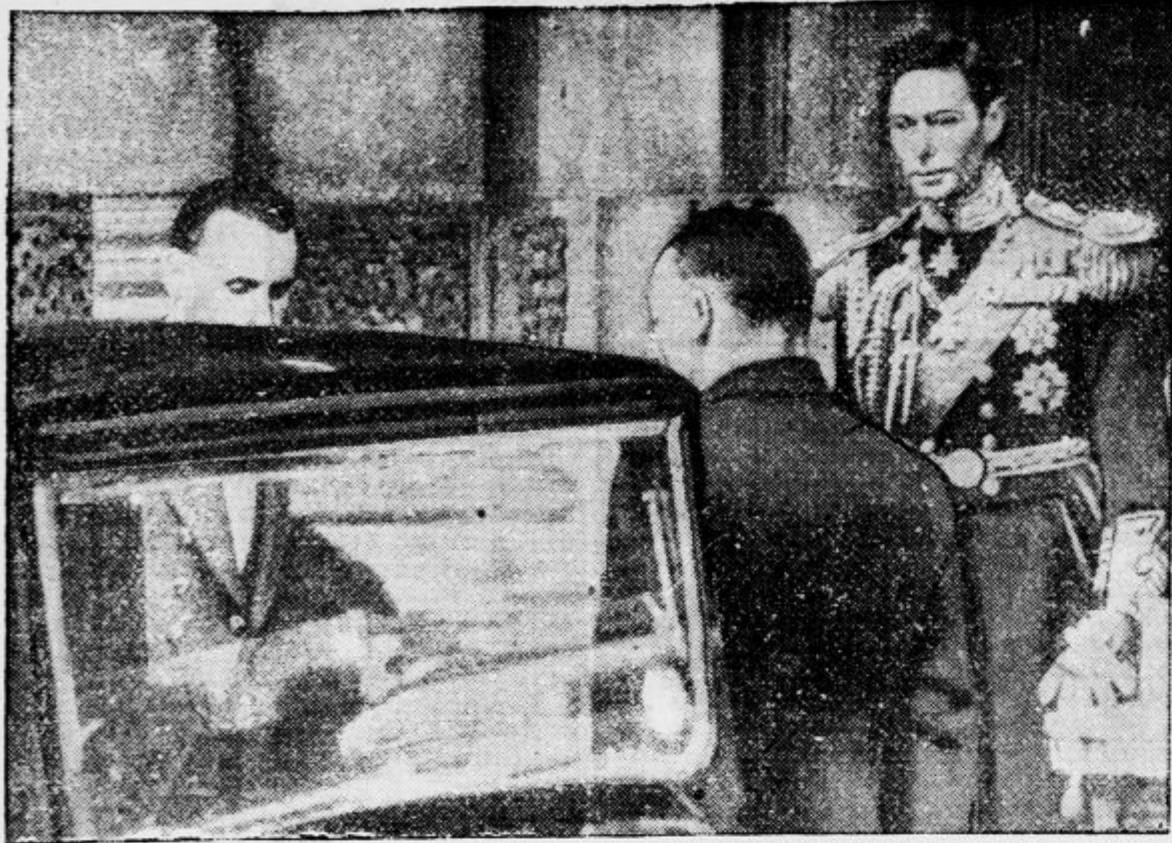
Novi angleški kralj Jurij VI., v admiralski uniformi