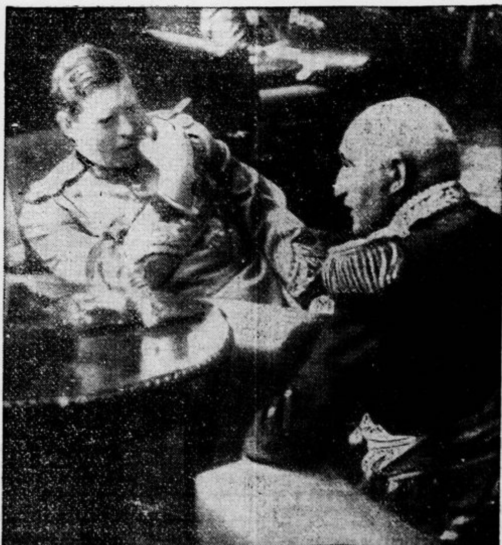
Veliko pozornost je zbudila pred dnevi izjava francoskega generala Mittelhausserja, da bo francoska vojska v primeru potrebe branila tudi rumunsko mejo