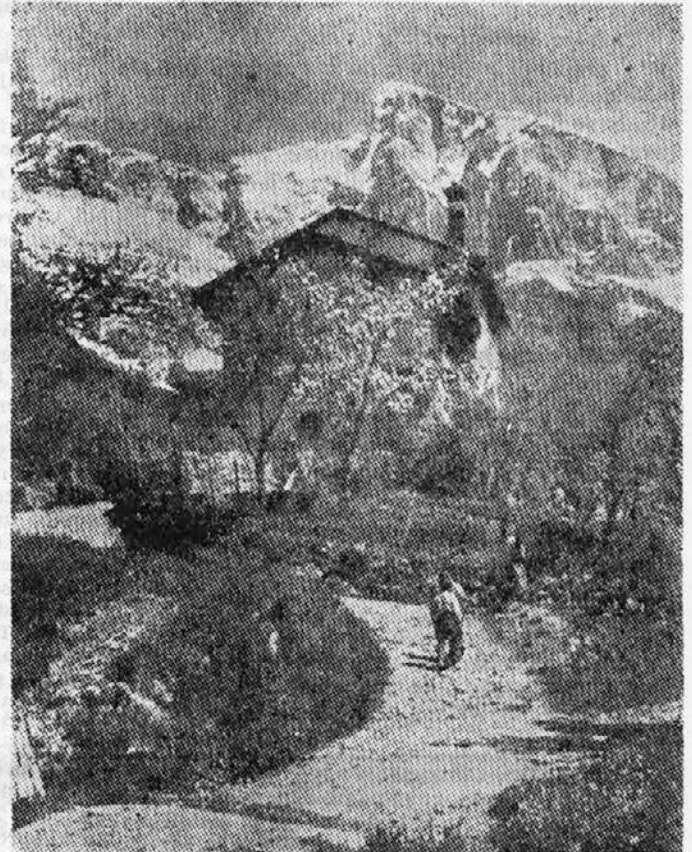
POMLAD POD KRNOM

Sijajna palača je največja v Evropi in je treba samo želeli, da bi v njej sedeli tudi sijajni ministri.