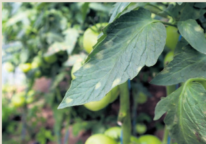
Ko na listih paradižnika opazite prve znake, je znak za alarm.

Začela bom z najmanj znano boleznijo, žametno pegavostjo. Pojavlja se samo v rastlinjakih, na prostem je ne boste našli. Zanj je značilno, da se pojavi lahko tudi po nekaj letih pridelave v rastlinjakih, medtem ko je prej ni bilo. A ko se enkrat pojavi, boste imeli z njo težave za vedno. Še ena značilnost je prav izrazita: nanjo so različne sorte zelo občutljive ali pa so odporne. Torej se ne bo pojavila na vseh sortah. Če pridelujete svoje seme, po rastlinjaku pogledajte, katere rastline