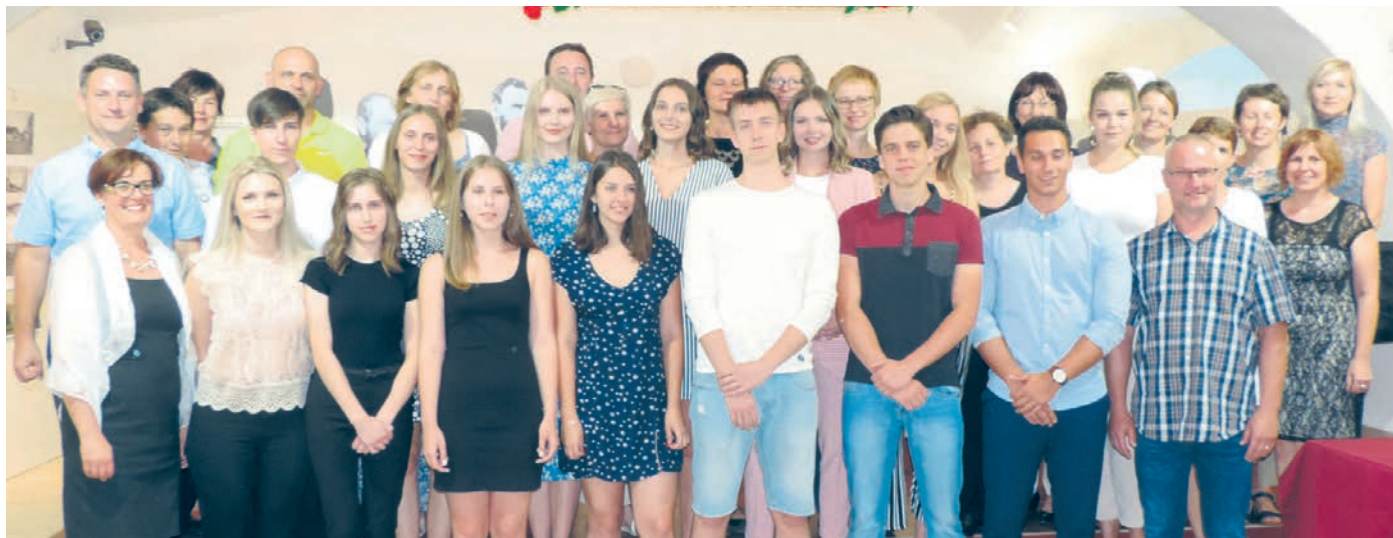
Maturanti skupaj s profesorji, ravnateljico in županom