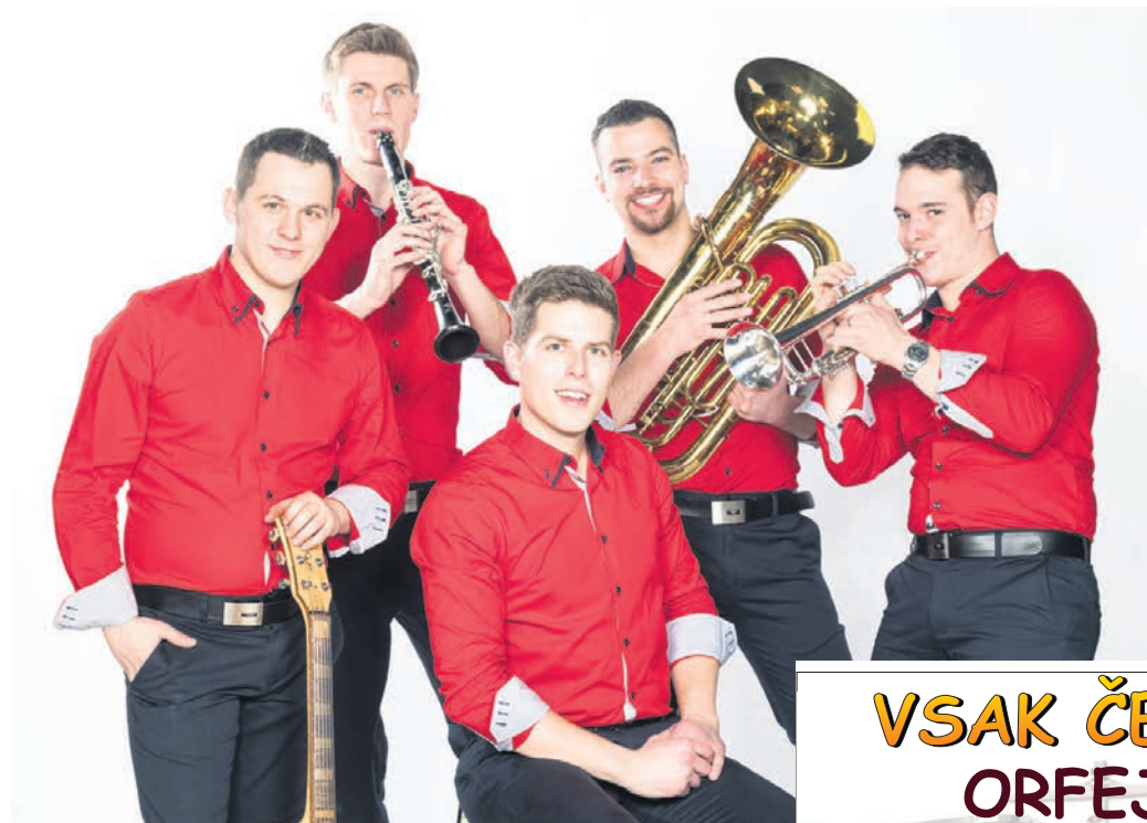
Ansambel Peklenski muzikantje

Preigravajo slovensko narodno-zabavno glasbo ter slovensko, angleško in hrvaško zabavno glasbo. Vso glasbo izvajajo popolnoma v živo. Člani ansambla so avtorji večine melodij in besedil, idej jim nikoli ne zmanjka, sodelujejo pa tudi z drugimi priznanimi pisci melodij in besedil. Repertoar sestavljajo predvsem po željah strank, ob igranju pa občinstvo navdušuje tudi z bogatim šov programom. Zelo