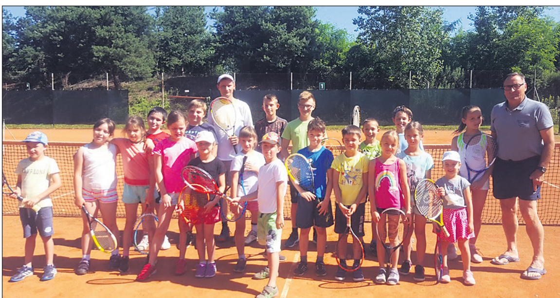
Sandi Mertelj Skupinska slika udeležencev 19. Poletne šole tenisa 2019 s trenerji

Tenis klub Skorba vabi vse mlade nadobudneže, da se priključijo njihovim aktivnostim, ki so seveda tudi povezane s šolo tenisa za mlade.