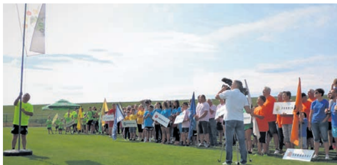
Z odprtja 21. vaške olimpijade