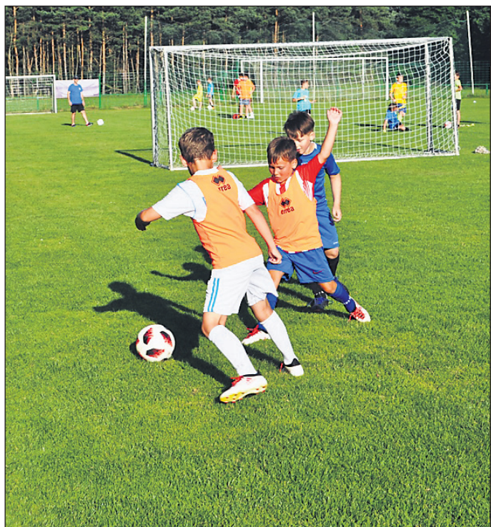
Utrinek s poletne šole nogometa, ki je bila tokrat organizirana v Gerečji vasi.