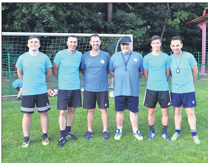
Trenerska ekipa, ki je skrbelo za približno 80 otrok