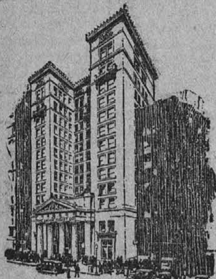
The Union Trust Company Preje The Citizens Savings and Trust Company.