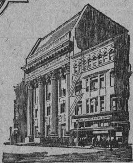
First Office in First Trust Office Preje The First National Bank in The First Trust & Savings Company.

kupite Labor Temple Coupons. Vaše neprestane zahteve bodo primorale trgovce kupiti vedno več teh kuponov in prav lahko zapopadete kaj bo rezultat tega delovanja. Edino kar vam je treba storiti je vprašati za kupone. Veljajo vas nič, toda zanje vam bo izdelal Labor Lyceum Co. delnice pri Delavskem domu.