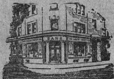
Urad na zapadni 25. cesti in Dennison Preje the Citizens Savings and Trust Company.