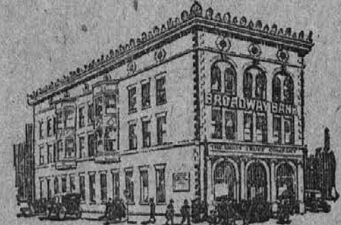
Urad Broadway Banke Preje The Broadway Savings & Trust Company.

Clevelandska največa banka hoče biti vaš največji prijatelj Kapital in prebitek presega $30,000,000