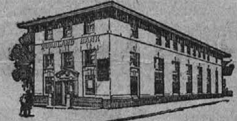
Urad na Buckeye Rd. Preje Buckeye poslovavnica Woodland Avenue Savings and Trust Co.