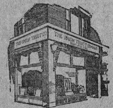
Urad na Euclid Ave. in 101. St. Preje The Citizens Savings and Trust Company.