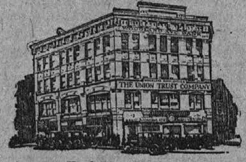
Urad Woodland Bank Preje The Woodland Avenue Savings and Trust Company.