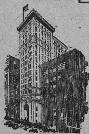
Union Commerce urad Preje The Union Commerce National Bank.