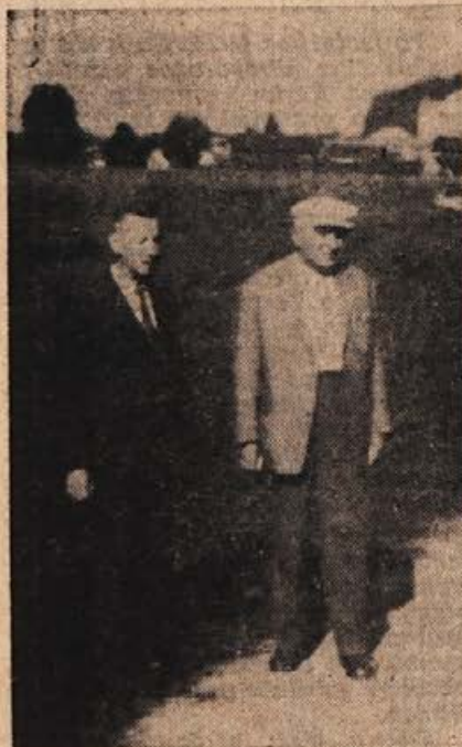
Božo Borštnik s pesnikom Alojzom Gradnikom na poti iz Podbočja v Kostanjevico