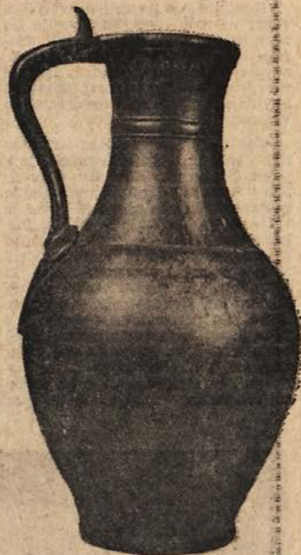
Bronasti vrč — kana iz I. stoletja našega štetja

Poleg teh živih krajevnih imen iz 8. stol. (Atamine, Cruppi, Nomiduni, Sicco) navaja neznan geograf iz Ravenne še druge skupine krajevnih imen (Acerbe pri Stični, Romulo pri Mokricah, Fines med Mokricami in Siskom), ki v šestih stoletjih niso prav nič spremenila svoje antične oblike. To nerazumljivo zemljepisno dvojnost je pojasnil podoben študij zgodovine Teodorikovega ravenskega kraljestva (Cassiodor). Kraji, ki jih navaja ravenski geograf, so v resnici pošne postaje