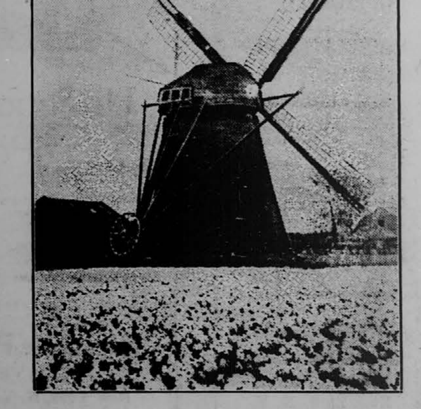
Mlin na veter blizu mesta Haarlem na Holandskem. Vsa okolica je pokrita s tulipani.