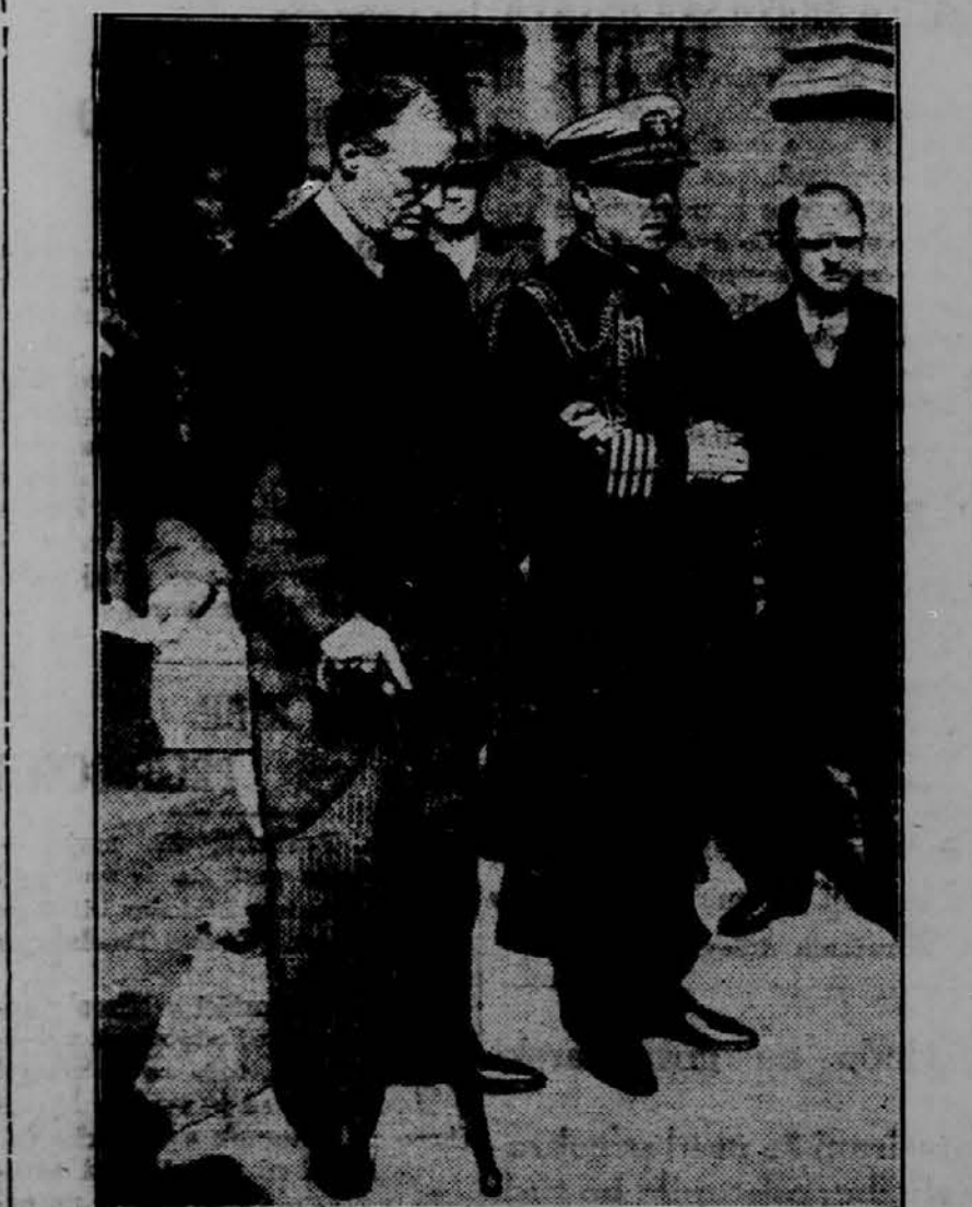
Slika je bila posneta, ko se je predsednik Roosevelt udeležil pogreba svojega prijatelja in prvega državnega zakladničarja...