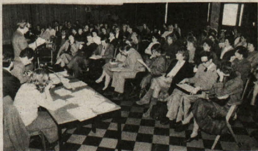
Sindikat slovenske šole-tajništvo Trst je imel včeraj v mali dvorani Kulturnega doma v Trstu svoj 27. občni zbor, na katerem so se tržaški šolniki med široko razpravo dotaknili konkretnih vprašanj našega šolstva