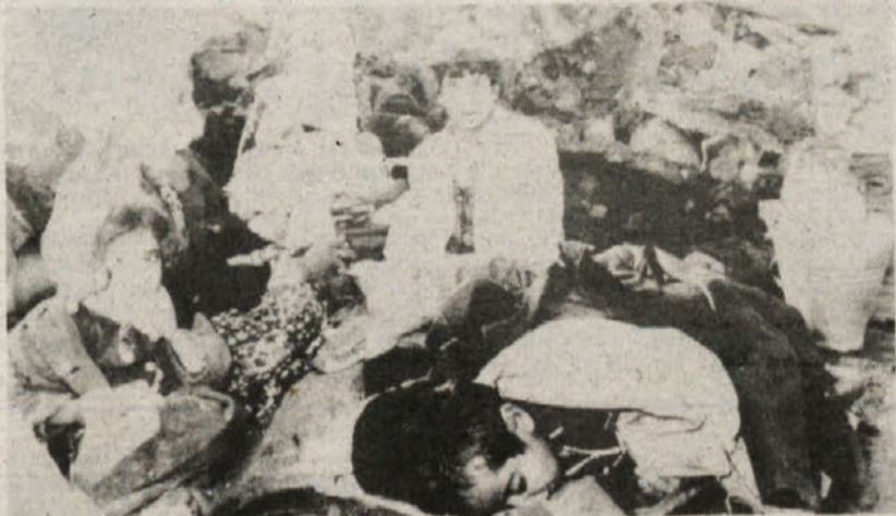
Prestrašeni in premraženi otroci na potresnem območju

ERZURUM (Turčija) — Obračun žrtev potresa, ki je v nedeljo prizadel širše območje pri Erzurumu v vzhodni Turčiji, je iz ure v uro težji. Reševalci so do sedaj izpod ruševin odkopali približno tisoč trupel, oblasti pa se upravičeno bojijo, da bo končni obračun še težji. Petindvajset minut trajajoči sunki, ki so dosegli 6,5 stopnje po Richterjevi lestvici, so namreč dobesedno zravnali z zemljo 34 vasi. In prav tu je reševanje najtežje, saj je potres dokončno onemogočil redke kolovoze, da prihaja pomoč v glavnem s helikopterji, saj se reševalne ekipe le počasi prebijajo po skoraj neprehodnem terenu, ki ga je dokončno razmočilo nekaj dni trajajoče deževje.