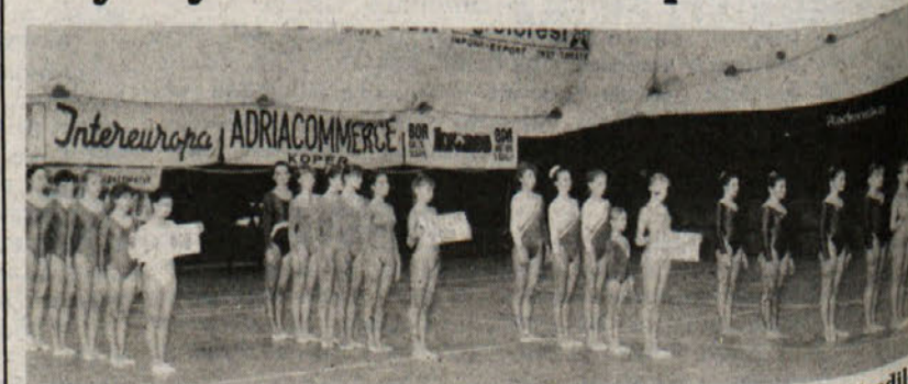
Na sobotnem tekmovanju v športni ritmični gimnastiki, ki ga je priredilo SZ Bor, so premočno zmagale ljubljankanke pred Ginnastico Triestina in Borom