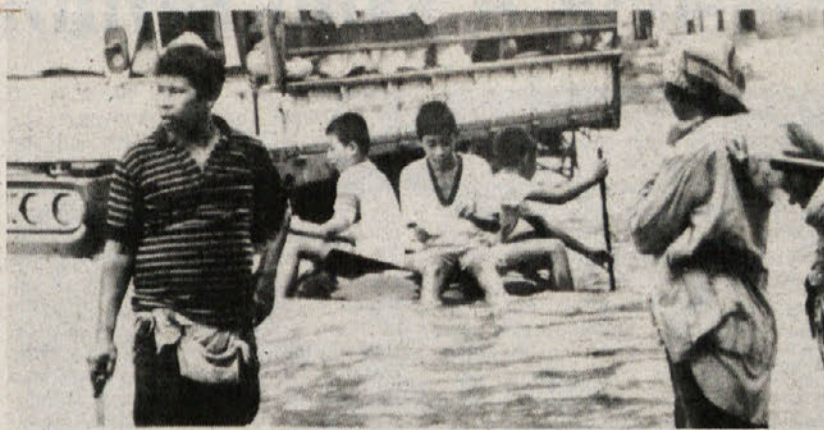
Bangkok, glavno mesto Tajske, je bil v prejšnjih dneh spet pod vodo in glavne ulice so bile bolj podobne rekam kot cestam. Kaže, da je problem sezonskih poplav še zaostrolo nesmotrno izkoriščanje arteških vrelcev