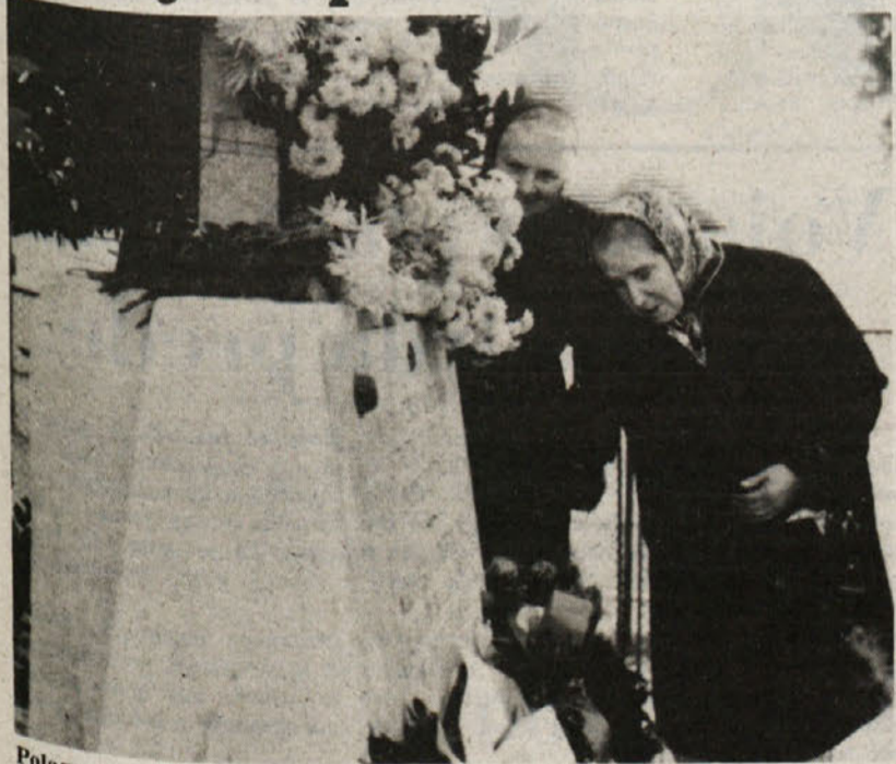
Polaganje cvetja na bivšem spomeniku žrtvam v tržaški Rižarni (arhivski posnetek)