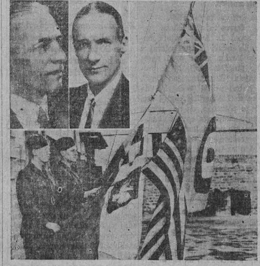
Nekje v Angliji, kjer je letališče poljskih letalcev, se razvijajo poleg poljske in angleške tudi ameriške zastave. Zastave so bile razvite ob priliki obiska poljskega predsednika Raczkiwicza (zgoraj na levi) in Anthony Drexel Biddle-a, ameriškega poslanika za Poljsko (na desni).