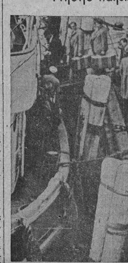
Na gornji sliki vidimo skupino nazijskih mornarjev, ki jih je prišla ameriška vlada ter poslala v koncentracijsko taborišče.

gledal je proti hiši; še je gorela luč v izbi. Spotaknil se je nad korenino in padel. Ko se je pobral, se je prestrašil sence, ki se je bila dvignila z njim vred in hitela dalje. Tedaj je luč v hiši nenadoma ugasnila. Jože je za trenotek neodločen postal. — Že je stopil mimo kozolca, noge so mu bile kot iz svinca, da jih je s težavo vlačil za seboj. Med sencami golih dreves pred hišo ga je objelo tako malodušje, da bi se bil najrajši vrnil. Stopil je dalje. Hišna vrata je našel zaprta, to mu je nalilo nove odločnosti. Potrkal je najprej na vrata, nato je stopil do nizkega okna. Anka se je bila ravno slekla, ko je zaslišala trkanje. Ogrnila si je ruto in stopila do okna. "Odpri!" Odšla je v vežo. Jože je tolkel po vratih z nogami in s pestmi, da je odmevalo po vsej hiši.