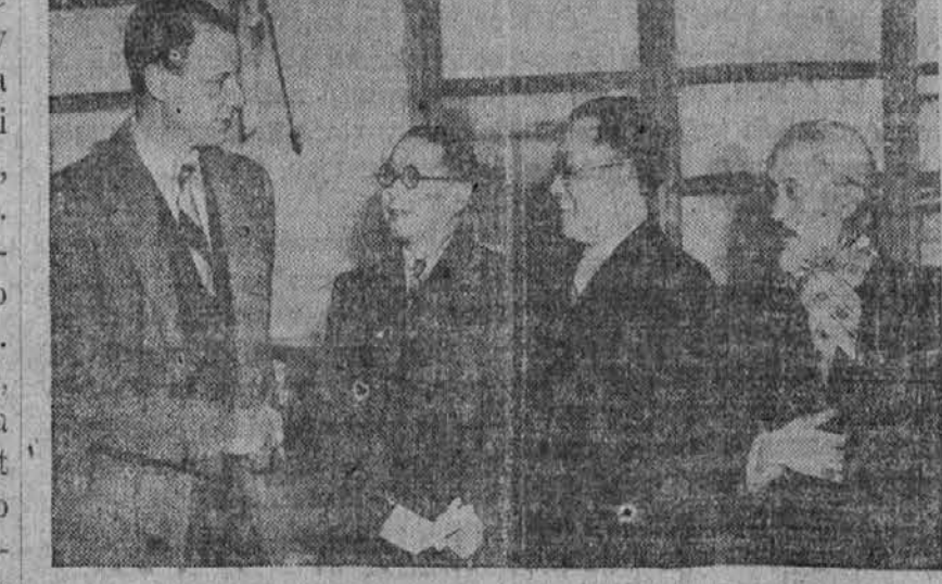
Kitajski poslanik v Londonu, dr. Quo Tai-Chi, ki je bil imenovan za kitajskega ministra zunanjih zadev, je prisel te dni, na počtu proti Kitajski, v New York, kjer so ga pozdravili osebni odposlanci kitajskega maršala Čiangkašeka.