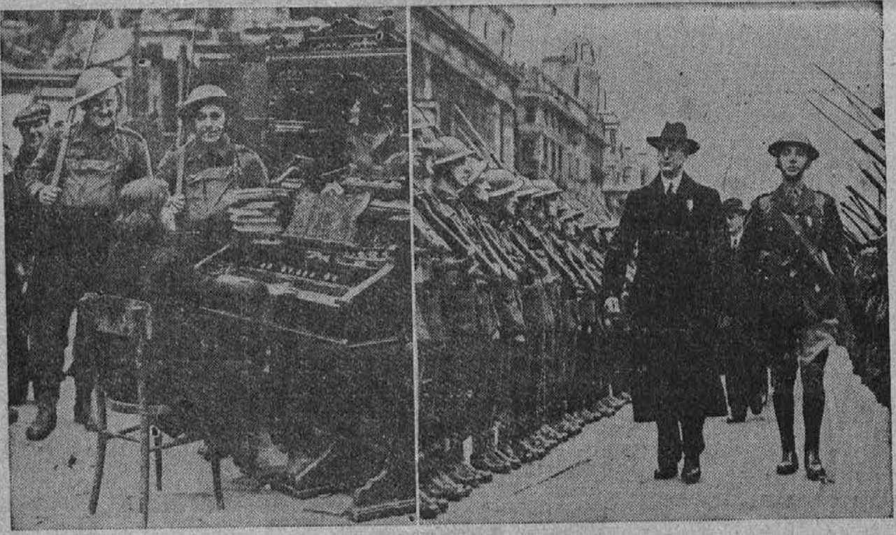
Na sliki na levi vidimo neformalen koncert na ulici v Belfastu na Irskem, katero mesto so bombardirala nemška letala, katerih bombe so ubile nad 500 oseb. Na desni pa stoji v pozoru odred irske vojske, ki jo pregleduje irski premier Eamon De Valera.