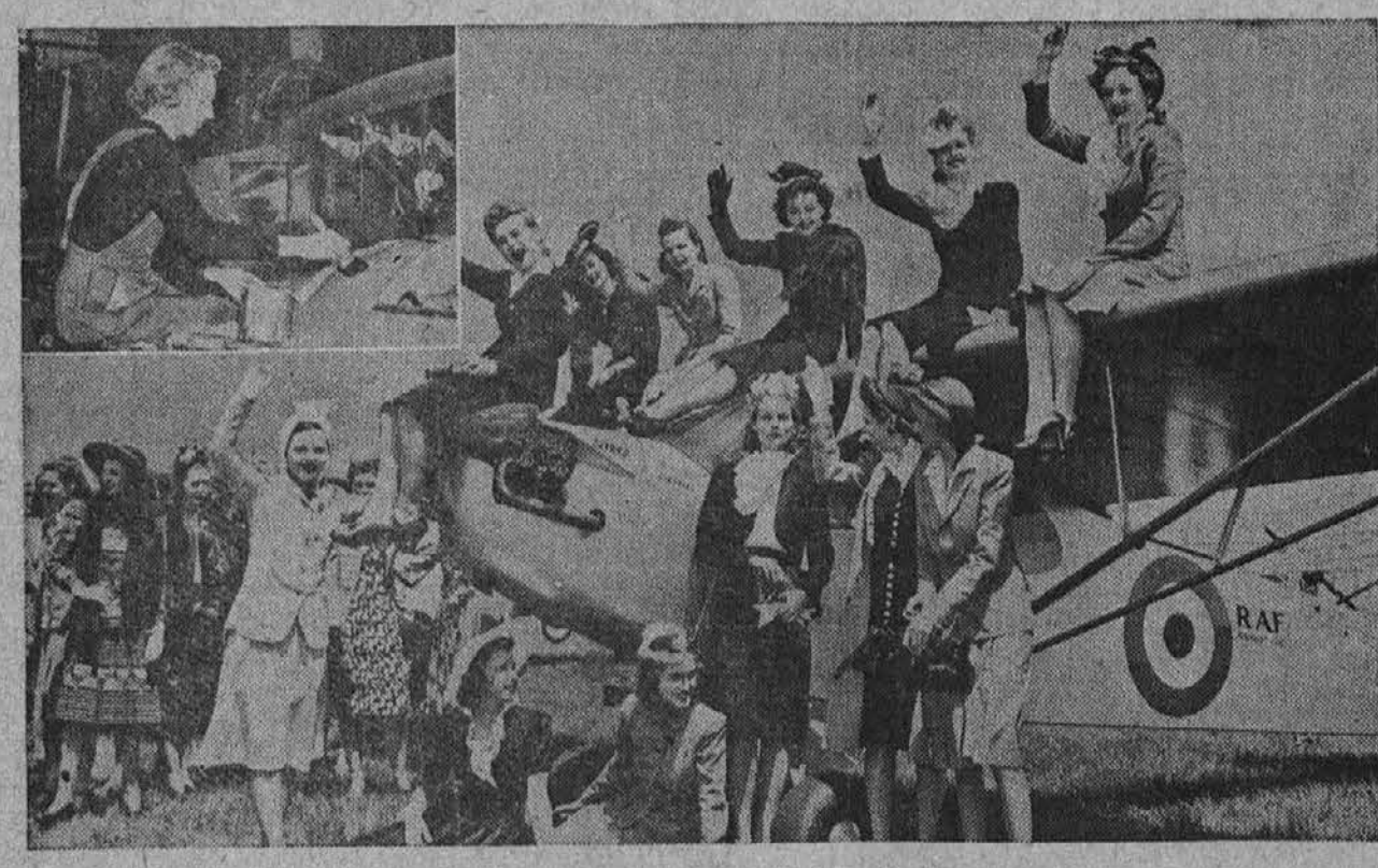
Nedavno je bila "krščena" v New Yorku skupina lahkih bojnih letal, ki so bila kupljena s prostovoljnimi darovi. Na sliki je skupina mladenk, ki so se udeležile te proslave. V gornjem kotu na levi vidimo pri delu v tovarni za izdelovanje letal neko žensko, ki je tam zaposlena. Ženske so prevzele več moških poklicev, ker odhaja moško prebivalstvo na vojno.