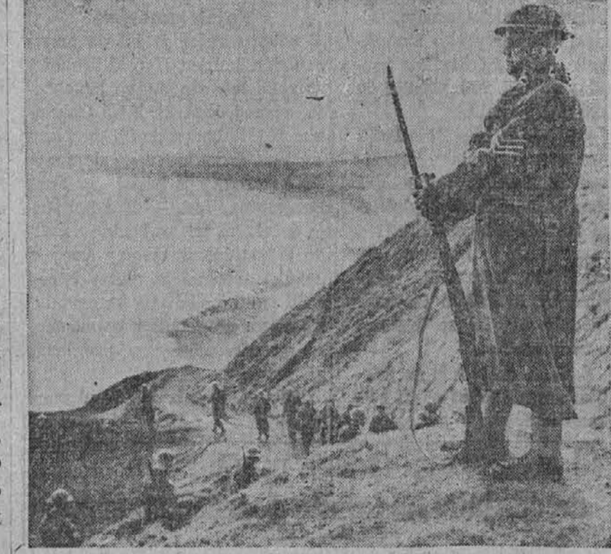
Na gornji sliki vidimo starejšega seržanta, ki straži pešne angleške obrežja, kjer utegnejo Nemci tvegati poizkus svoje invazije.