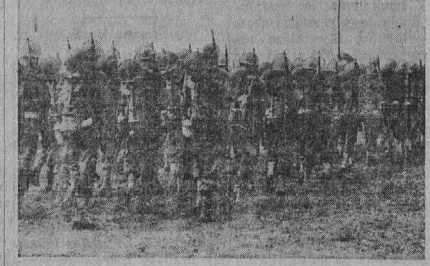
Na sliki je vojaštvo ameriške armade, opremljeno z novo vrste čeladami. Čelade, ki jih ima na glavah vojaštvo na gornji sliki, so iz vlakenske tvornice, ko pa gre vojaštvo v boj, si posadi vrh teh pokrival še čelade iz jekla, kij ki jih nosi na hrbtih.