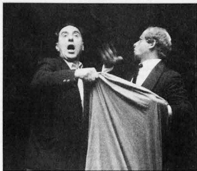
Moliere - Scapinove zvijače