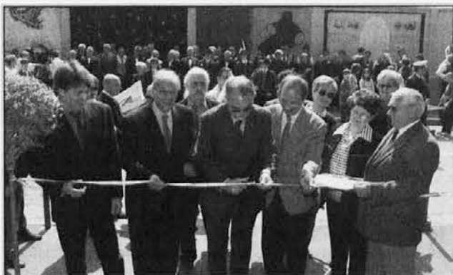
Otvoritev prenovljenega parka Attems v Podgori

Predsednik pokrajinske uprave pa je ob tej priložnosti na kratko analiziral ekonomsko-politično stanje Goriške. V nekaj dneh je navalilo v sejemске prostore ogromno ljudi iz vse dežele, Veneta, Slovenije in celo Hrvaške, in to tudi zato, ker je bil vsopokrat prvič zastoj.