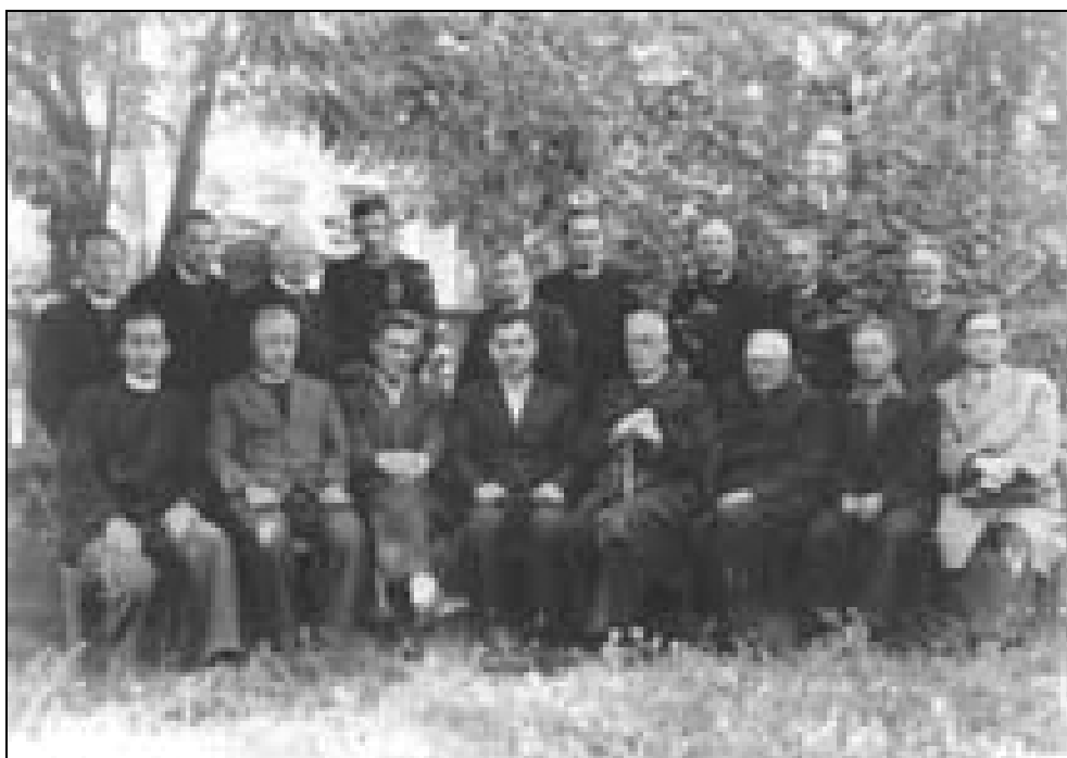
Sestanek Glavnega odbora CMD v Ljubljani, 25. oktobra 1949, (PANG, Okrajni komite ZKS Tolmin, š. 11).

podpisali duhovniki člani OF 22. julija 1949 na sestanku odbora za Slovensko Primorje. Odbor je ostro obsodil vsako "razdiralno početje reakcionarne duhovščine, ki naj bi se za svoje temne namene posluževala tudi duhovnikov iz odbora" . Zavračali so prepoved Biltena, ker so v tem videli dejanje, naperjeno proti OF in ljudski oblasti, ter poskus razbijanja enotnosti katoliških "ljudskih" duhovnikov. Zahtevali so, naj koncilska kongregacija prekliče dekret o prepovedi. Protestirali so proti "lažnivemu poročanju radia Vatikan" in apelirali na Sveti sedež, naj sproži vse potrebne korake za ustanovitev nove enotne cerkvene enote v Slovenskem Primorju, ker bi to koristilo religioznemu življenju rimskokatoliške cerkve. 68