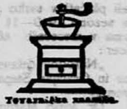
TOVARNA KAVNA MLEČNA

V Vaš pridobode, bodete li pri nakupovanju dajali prednost temu izvrstnemu proizvodu pravemu :Franckovem: kavnem pridatku z minškom, iz zagrebške tovarne.