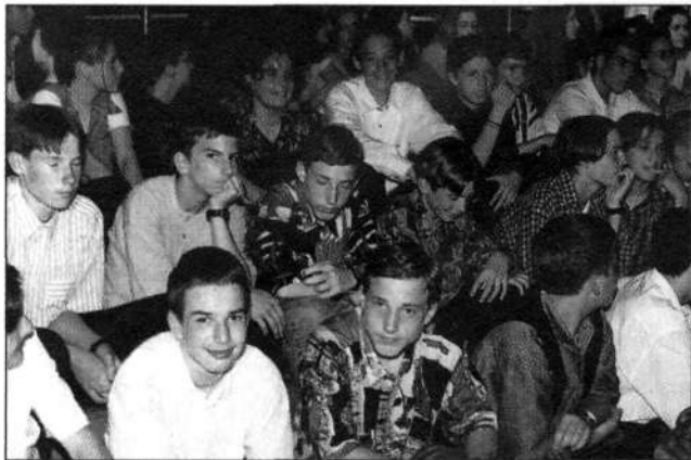
Brežiški osmošolci: kod plovejo njihove misli?