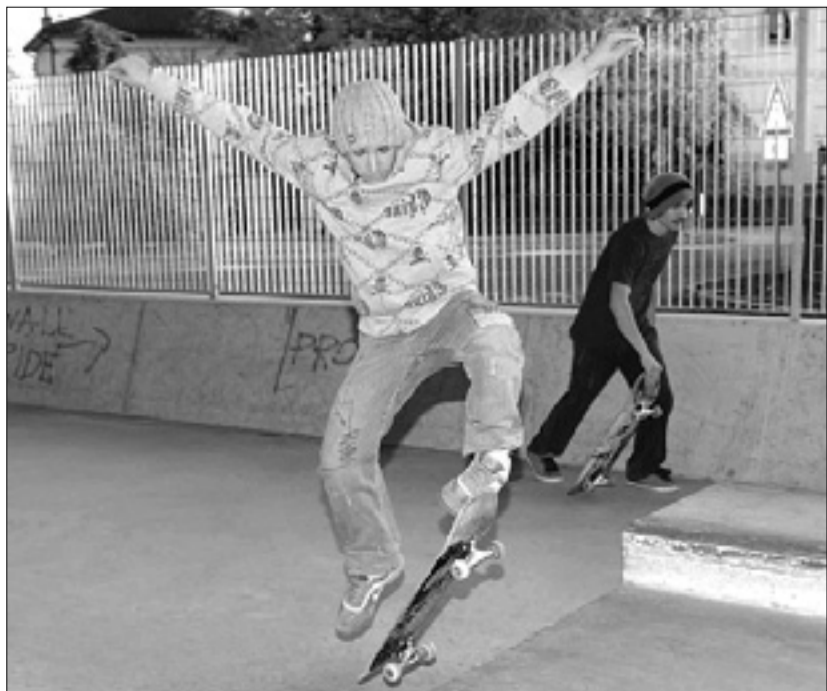
Goriški skate park

Mladi iz Italije, Slovenije in Avstrije se bodo pomerili v soboto, 27. marca - Po tekmi praznik v ločniškem lokalu Piefte factory