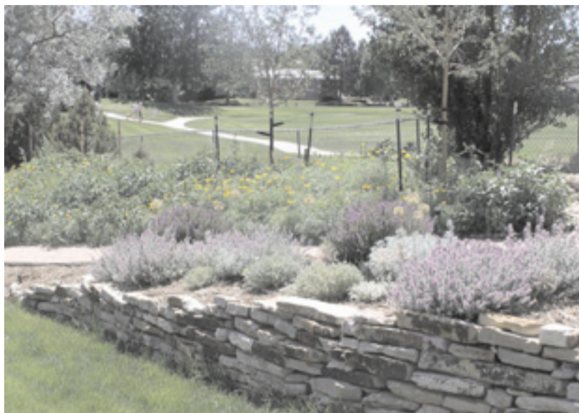
Sivka dobro prenaša suha primorska poletja in je zaradi tega primerna za naše vrte.

V preteklosti, predvsem pa v obdobju baroka, je vrt pomenil družbeni status lastnika. Danes nam vrt predstavlja varno zatočišče, kamor se v toplejših dneh umaknemo po prihodu iz službe, v hladnih dneh pa nam omogoča povezavo, četudi na daljavo, z naravo. Blagodejni učinki vrta so neprecenljivi, je odlično gledališče, kjer so rastline in živali glavni igralci. Zato tudi mora biti ta prostor narave, varnosti in zasebnosti skrbno negovan: pozimi je treba porezati mnoge listopadne grmovnice in drevesa, pomlad pa je čas za odstranitev odmrlih pogankov in dodajanje komposta na grede. Če vrt seveda že imate. Če ga še nimate in si ga želite, vedite, da je mnenje, da samo gradnja objekta zahteva tehtno načrtovanje, zmotna. Tudi ureditev vrta mora slediti jasno začrtanim idejam, če lastnik ne želi čez nekaj let biti razočaran nad podobo vrta.