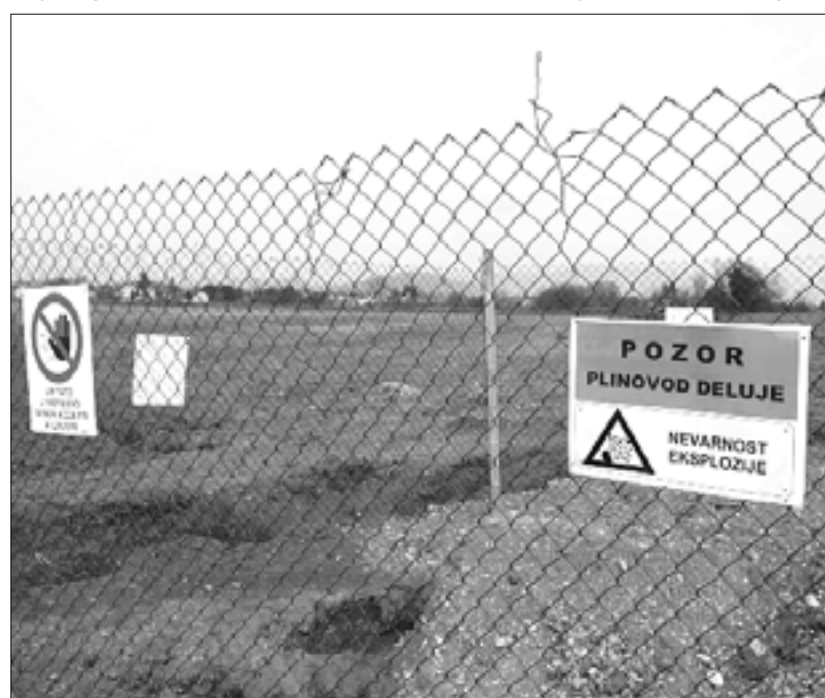
Gradbišče plinovoda s slovenskim napisom o nevarnosti eksplozije

Dela za nov plinovod z večjo zmogljivostjo so bila načrtovana že pred nekaj leti. Novi plinovod bo vkopan v glavnem po in ob trasi obstoječega, le na nekaterih mestih bodo cevi speljale nekoliko drugače, za kar je bilo potrebno razširiti pas, kjer so uvedli služnostno pravico na zemljiščih. Plinovod je na območju sovdenske občine speljan precej daleč od bodoče avtoceste. Sočo prečka pri Fari, Vipavo pa pod nekdanjo železniško postajo in v bližini železniškega mosta pri Rubijah. Skozi Dolino in vzdolž železnice je plinovod speljan skoraj do Škrli, kjer zavije v desno in ob robu letališča teče do meje s Slovenijo. V Škrli je tudi krak plinovoda proti Goriški industrijski coni. Bolj zapletena je gradnja novega plinovoda pri Vilešu, zaradi načrtovanih gradenj prometnih povezav in drugih objektov.