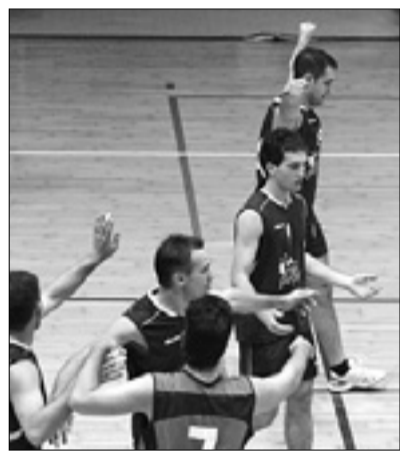
Brici še v boju za play-off KROMA

V ženski D-ligi morajo Kontovelke paziti, da ne ponovijo spodrselja iz prejšnjega kroga, ko so v okrnjeni postavi nepričakovano izgubile proti sicer