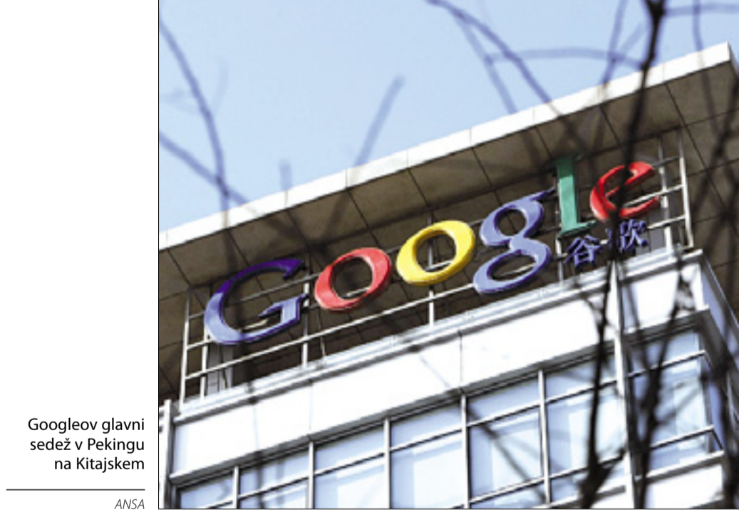
Googleov glavni sedež v Pekingu na Kitajskem