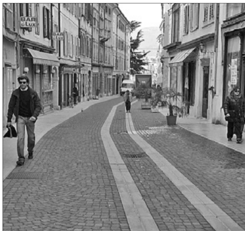
V Raštelu bodo kmalu namestili klopi in cvetlična korita