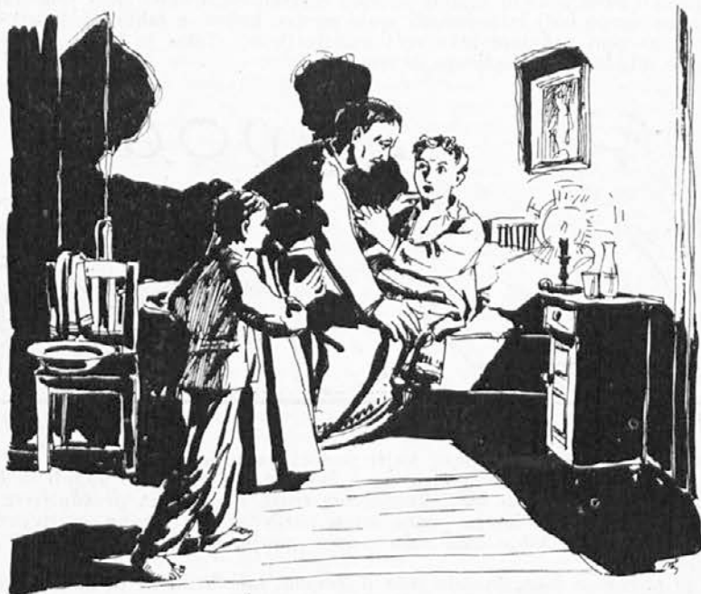
Ko se pater skloni nad Bernardom...