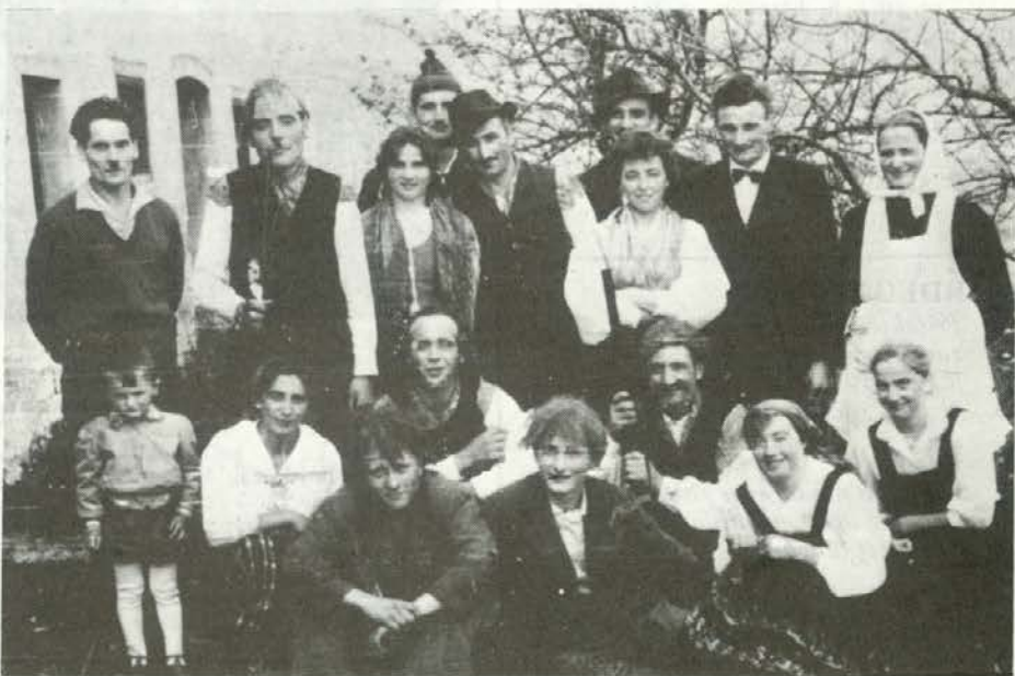
Igralci igre »Krivoprisežnik« v Razboru leta 1962.