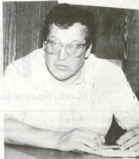
Mag. Jože Protner, minister za kmetijstvo in gozdarstvo