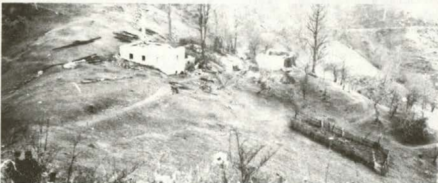
Ostrčnjakovo po požaru ...!