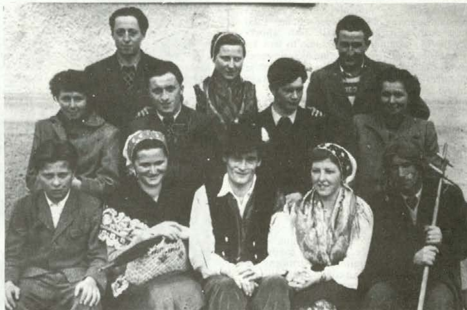
Igralci igre »Vdova Rošlinka« v Razboru leta 1954.