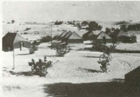
Naš tabor v El Arišu