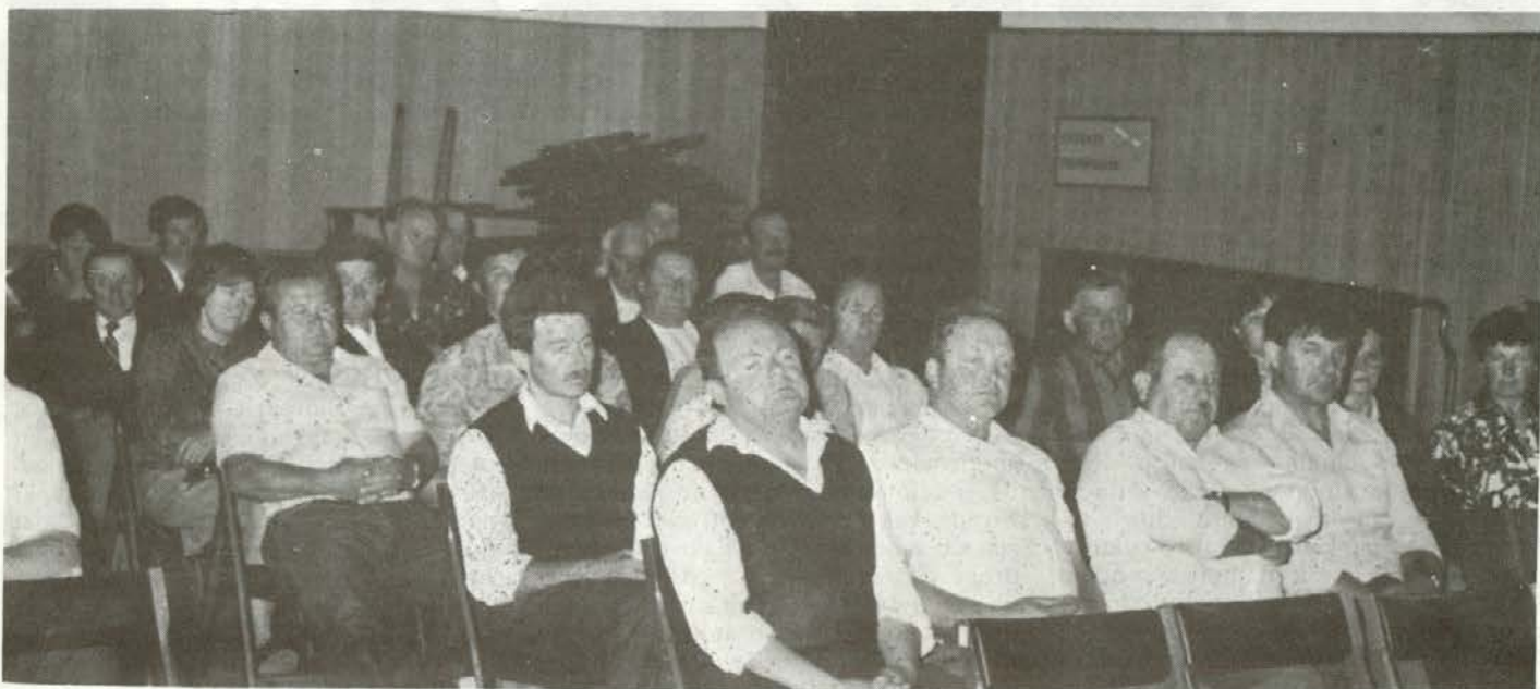
Ustanovni občni zbor Gozdarske zadruge Slovenj Gradec

dumu odločili kmetje, dosedanji člani zadruge, ki jim je hkrati s to odločitvijo prenehalo tudi članstvo v teh kmetijskih zadrugah. Po predhodnih razpravah v zadružnih organih in na zborih so se tako kmetje odločili, da bodo ustanovili (Nadaljevanje na 4. strani)