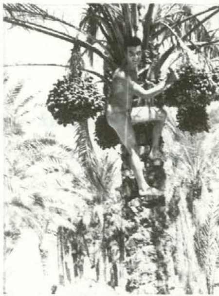
Tudi »Tarzane« smo se šli

Odpeljal sem se na bližnji trg in si med kupi banan, pomaranč, mandarin ter lubenic, ogledoval najmanj vsiljivega prodajalca. Raže so ti napolnili avto, kot pa vrnili drobiž, tako poceni je bilo. Z veliko slamnato košaro mandarin, sem se odpravil na mirnejši kraj.