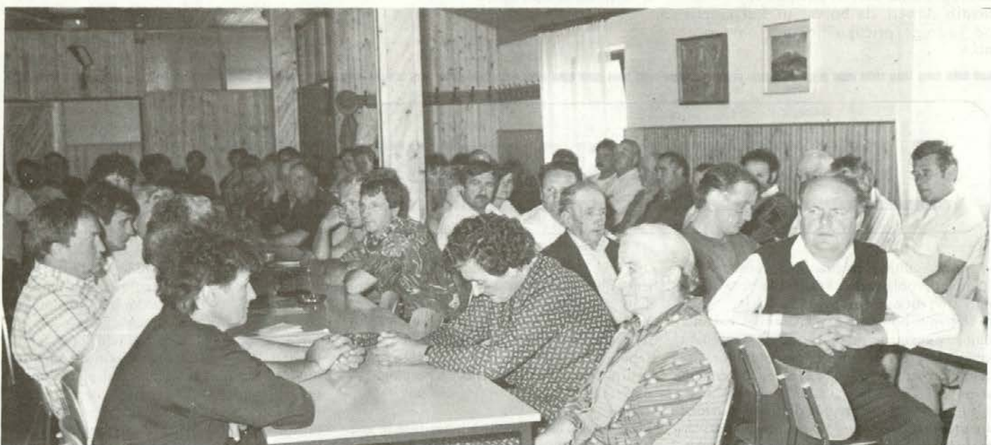
Na ustanovitvi kmetijsko-gozdarske zadruge Ledina Slovenj Gradec