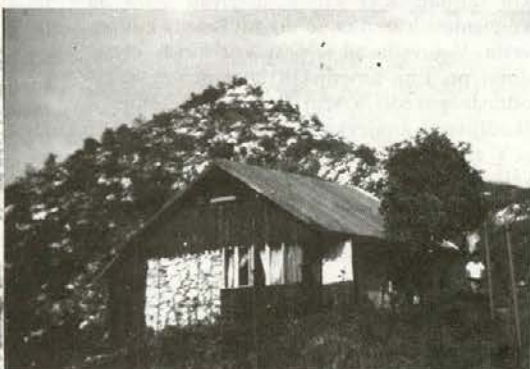
... in danes