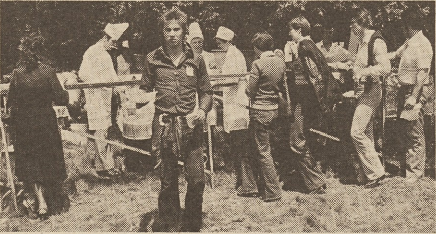
Vojaški pasulj je šel vsem v slast.