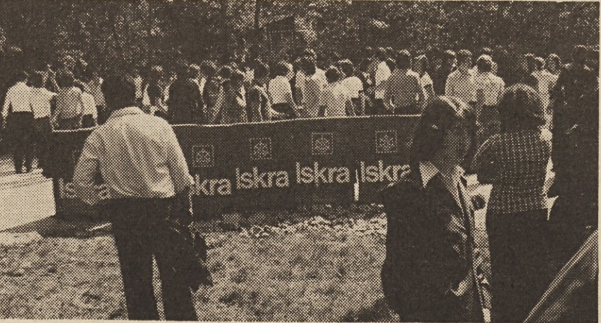
Mladi Iskraši so se zavrteli v veselem ritmu.