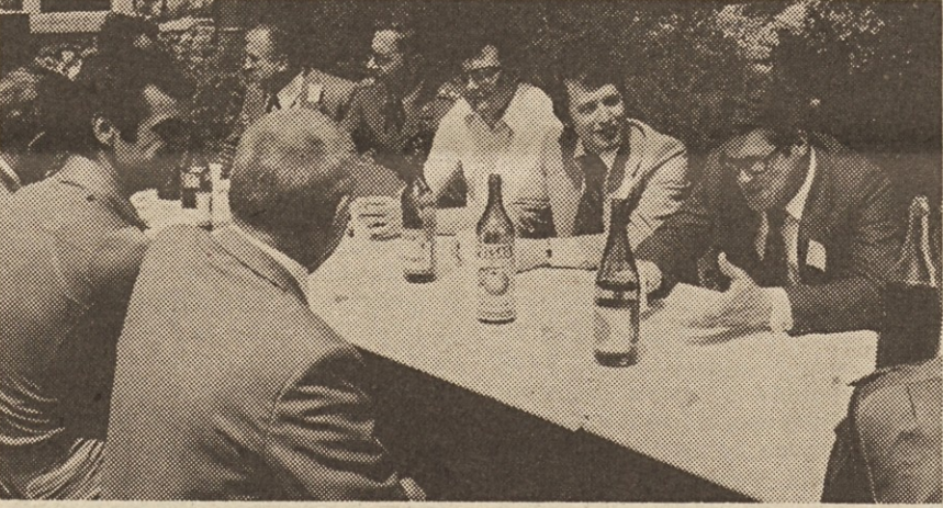
Častni gostje ob Jamarskem domu.