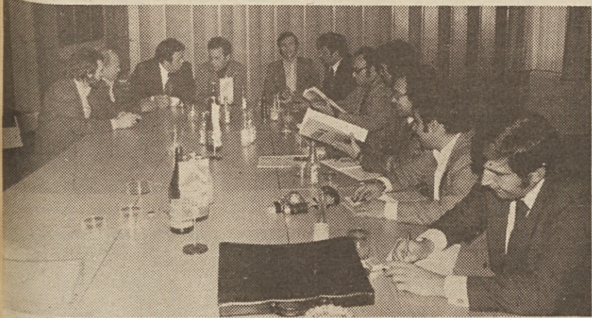
Delegacija španskih sindikatov na obisku v Avtoelektriki.