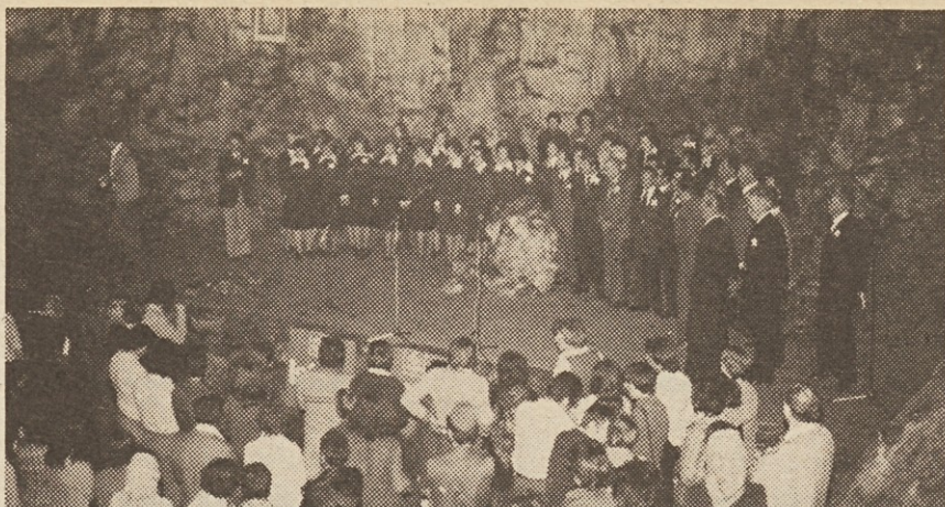
Kulturni program v jami Vilenici.