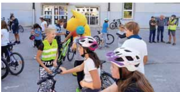
Slika 4: Kolesarski vrvež v tednu mobilnosti.