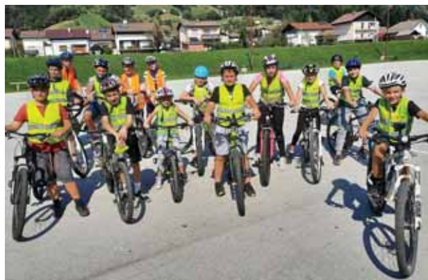
Slika 5: Skupina Varna pot vsepovsod (lasten vir).