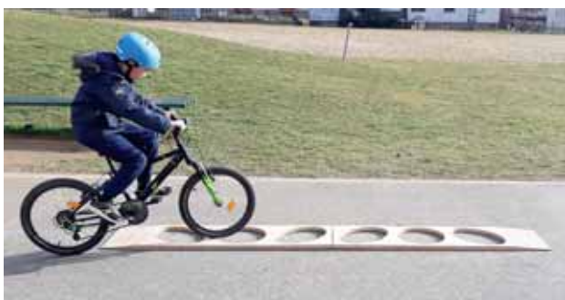
Slika 3: Na poligonu.