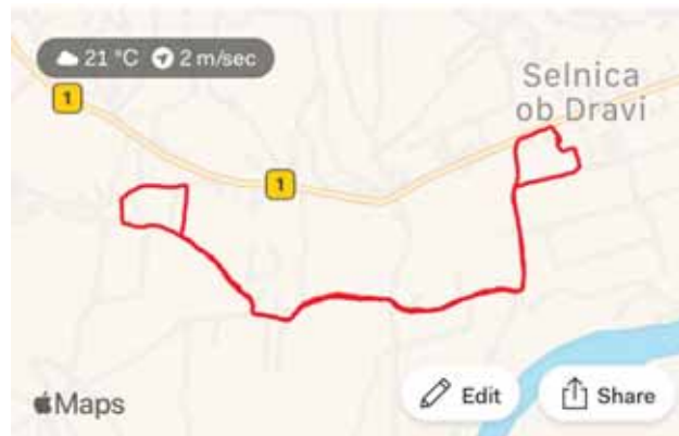
Slika 7: Zbiranje kilometrov z mobilno aplikacijo

Svoj odnos bi radi prenesli tudi na druge učence, delavce šole in lokalno skupnost. Analiza anketnega vprašalnika je že pokazala, da tudi drugi učenci, ki imajo opravljen kolesarski izpit, v prostem času radi kolesarijo. S kolesom bi se pripeljali tudi v šolo, če pot ne bi bila predolga ali nevarna in če bi bila njihova kolesa v času pouka varna in hranjena v ustreznih prostorih. Z zbranimi podatki, ki jih bomo v šolskem letu zbirali pri aktivnostih, bomo skušali oblikovati načrt za izboljšanje kolesarskih zmožnosti za naše učence tako na področju varnosti, zdravja in dobrega počutja.