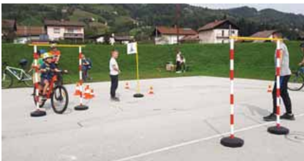
Slika 6: Medvrstniško sodelovanje.

Učenci in mentorica si v dejavnosti razširjenega programa Varna pot vsepovsod zastavljamo veliko izzivov. Kljub temu da aktivnost zaradi virusa Covid-19 občasno poteka tudi na daljavo, upamo, da nam bo zastavljene cilje v tem šolskem letu uspelo doseči. Do sedaj smo pridno koristili svoje možnosti in možnosti kolesarjenja v naši občini ter dokazovali, da je kolesarjenje učencev, ki obiskujejo dejavnost Varna pot vsepovsod , pogosta športna aktivnost, povezana z raziskovanjem, varnostjo, zdravjem, druženjem in predvsem dobrim počutjem ter aktivnim preživljanjem prostega časa.