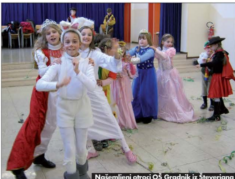
Našemljeni otroci OŠ Gradnik iz Števerjana

otroci posladkali z dobrimi, krhkimi "flancati".