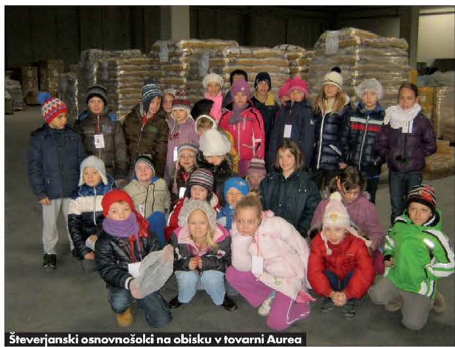
Števerjanski osnovnošolci na obisku v tovarni Aurea

le, luske, obročke in kolesca. Ko je testo dokončno izoblikovano, ga posušijo v sušilnici. Tudi učenci so stopili v sušilnico in bili presenečeni nad tem, koliko strojev in budnih oči je potrebno, da nastane "pašta". Najbolj pestro je bilo, ko so lastnoročno pomagali pri pakiranju testenin. Obisk se je končal z ogledom velikega skladišča, iz katerega je vsakdo lahko odnesel kilogram "pašte". Zavoječek so seveda izročili mami, da jim je za kosilo skuhala dobro "pašto".