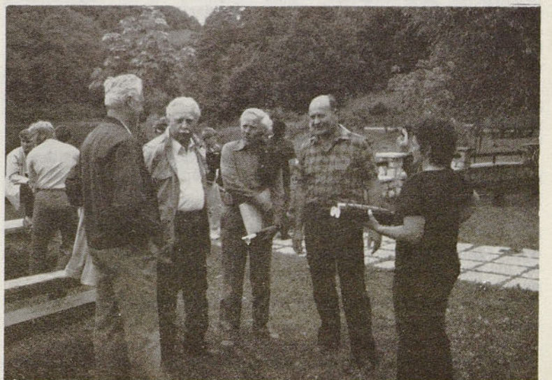
Upokojeni in še aktivni železarji v pogovoru. Če je bil ribiški, pa ne vemo.