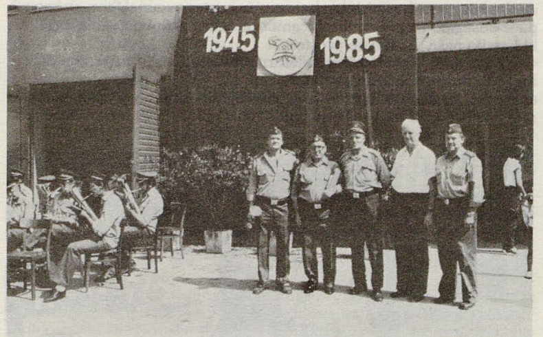
Pred objavo rezultatov in podelitvijo priznanj - pokalov

Na današnji dan pred 40-imi leti, to je dne 23. avgusta 1945, je bila na ustanovnem občnem zboru ustanovljena industrijska gasilska četa Železarne, kar praktično pomeni začetek organiziranega gasilstva v Štorah.