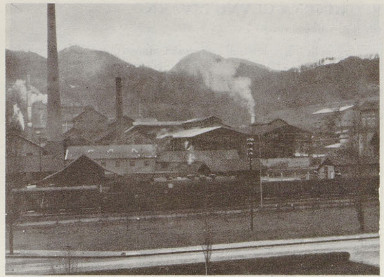
Železarna Štore 1958: v sredini med obema dimnikoma je visoka stavba cevne livarne