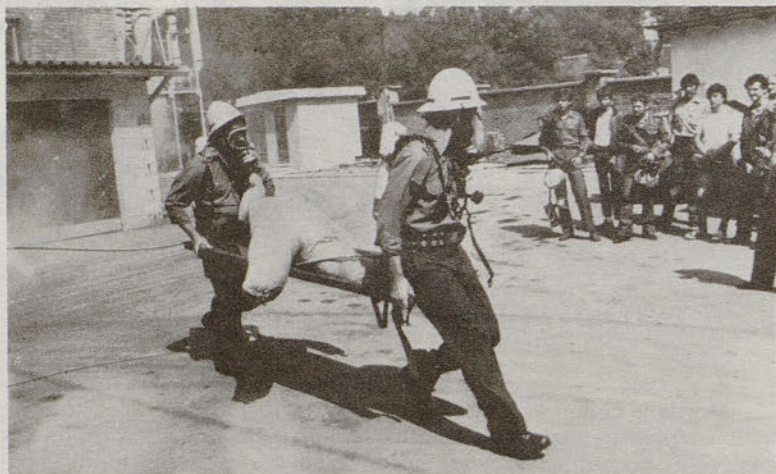
Poklicni gasilci iz Jesenic med vajo »Reševanje iz zadimljenega prostora«

Gasilsko društvo Železarne Store je za svoje uspešno delovanje prejelo tudi razna priznanja in odlikovanja. Društvo je nosilec srebrnega znaka Osvobodilne fronte, ki je bilo podeljeno ob 30-letnici obstoja, leta