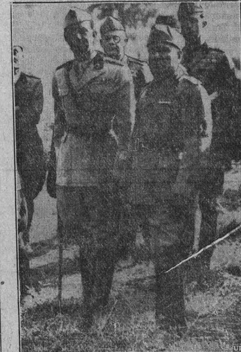
Kakor trdijo poročila, je Italija pripravljena, da vsak čas stopi v vojno na strani Nemčije. Na sliki je v ospredju na levi italijanski prestolonaslednik Umberto, na desni pa diktator Mussolini.