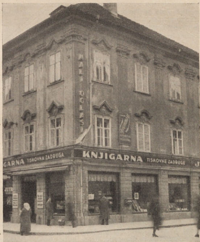
Koslerjeva palača s Schellenburgove ulice.