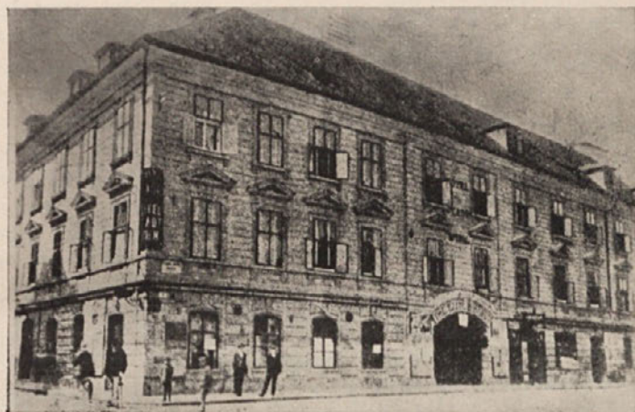
Hotel Malič (Stadt Wien)