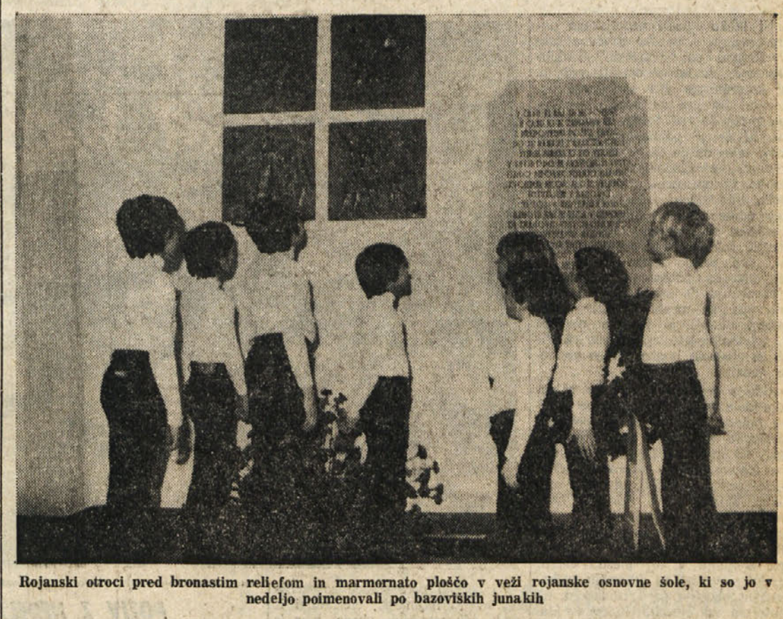
Rojanski otroci pred bronastim reliefom in marmornato ploščo v veži rojanske osnovne šole, ki so jo v nedeljo pomenovali po bazoviških junakih