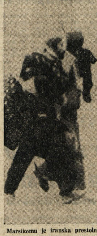
Marsikomu je iranska prestolnica postala prevročna