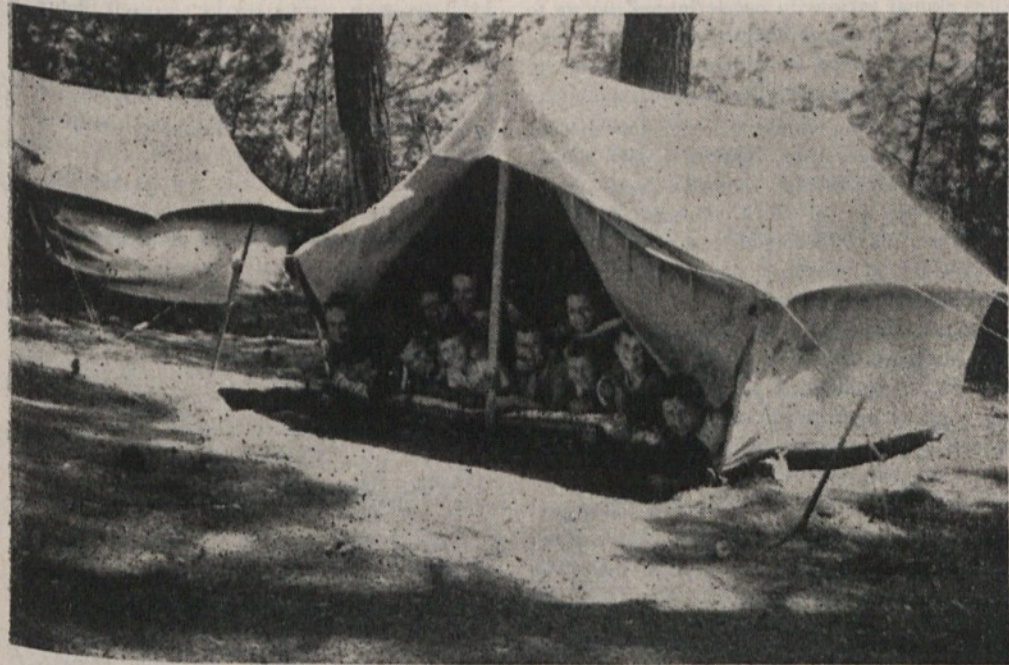
Le nekaj radovednih glav je pogledalo iz šotora, saj si med popoldanskim počitkom seveda niso smeli „privoščiti“ še kaj živahnjega. V taboru naših pionirjev v Rovinju pa vse dni od junija do začetka septembra, ni manjkalo smeha, zabave in dobre volje.

Posebnih obolenj ni bilo. V Logu pod Mangartom v dveh izmenah ni bilo nobenega bolnika, v Rovinju pa je bilo nekaj prebavnih motenj in nekaj prehladov, kar je ob morju dotrajane in potrebne čim prejšnjega popravila oziroma zamenjava. Zlasti so slabe postale in jedilnica. Letovišče v Logu pod Mangartom je bolj vzdrževano, vendar je tudi potrebno obnove, zlasti slamarice v posteljah.