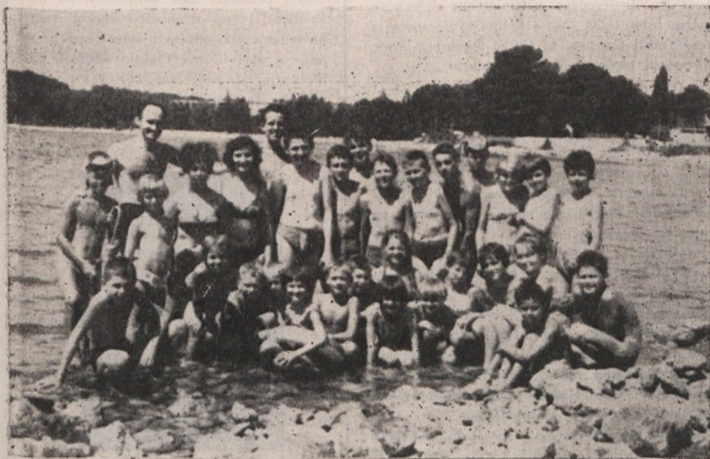
Naši otroci so se med letošnjimi počitnicami na morju, v Rovinju, dodobra odpočili in si nabrali tako novih močeh za novo šolsko leto. V spominu pa jim bodo še dolgo ostali dnevi, ki so jih preživel s svojimi tovariši na počitnicah ob morju.

Novost, da je moral otrok ob prijavi plačati kavcijo v znesku din 500, se nam je