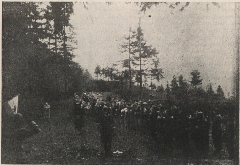
Zbor Dolomitskega odreda leta 1942 na Babni gori.

drugih brigad. 16. septembra 1943 je bil na področju Polhograjskih Dolomitov ustanovljen nov Dolomitski odred iz 2 bataljonov vendar pa je že čez dober mesec dni prenehal delovati, borci pa so bili vključeni v sestav enot XXXI. Triglavске divizije.