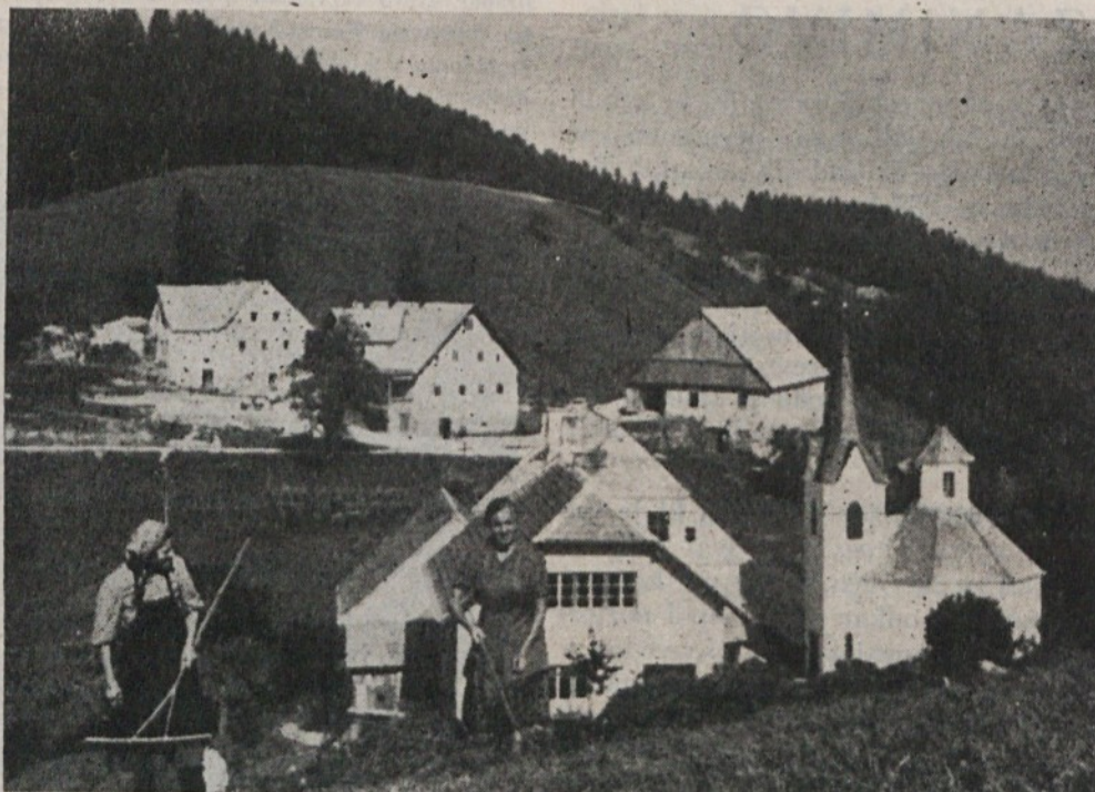
Z otvoritvijo novega gostilnasko-turističnega objekta, bo Črni vrh postal že v bližnji prihodnosti eno izmed naših najbolj obiskanih turističnih središč.