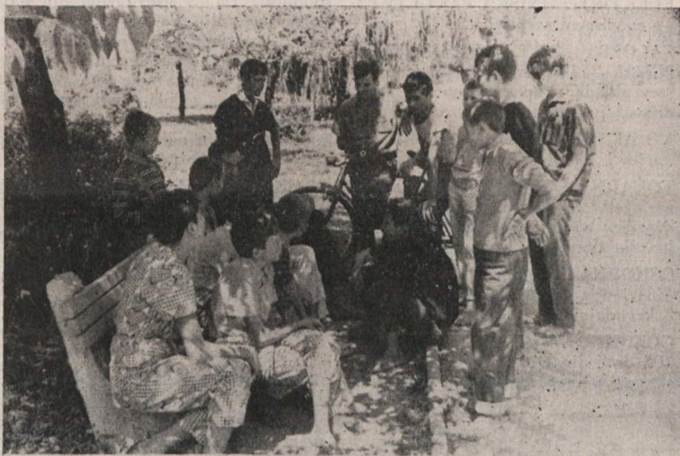
Obujanju spomninov na nesrečne dni so otroci odmerili precej časa.