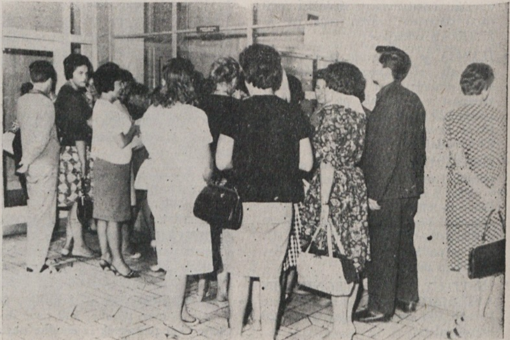
Še predno je do ljudi segla beseda o katastrofi v Skopju, so se številni naši občani, odzvali prošnji za pomoč in med prvimi ponudili svojo kri ponesrečenemu v makedonskem glavnem mestu.

obutve ter raznovrstnih oblačil je dosegla višino 1 milijona 36 tisoč dinarjev, vrednost živil pa je ocenjena na 2 milijona 326 tisoč dinarjev. Organizacije so namenile ponesrečenemu Skopju tudi ostalo blago v vrednosti nad 11 milijonov dinarjev, tako, da je naša občina prispevala makedonskemu glavnemu mestu pomoč v vrednosti 51 milijonov 365 tisoč dinarjev.