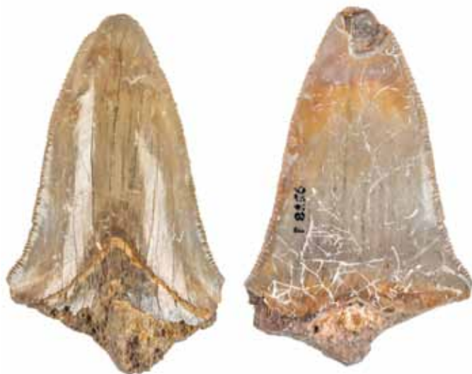
Fosilni zob morskega psa Megaselachus megalodon, izkopan na gomili pri Vačah.