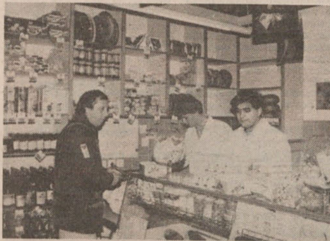
ZASEBNA TRGOVINA FORTIS