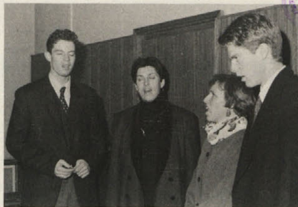
Abujevi so zapeli stricu v zadnje slovo