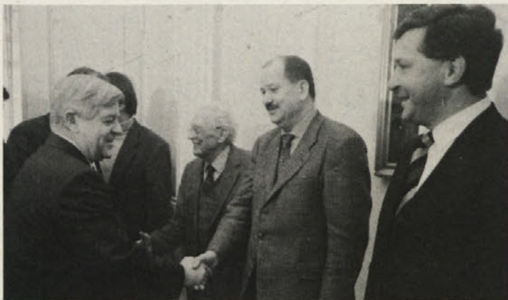
Predstavniki ZSO in NSKS na obisku pri predsedniku R Slovenije Milanu Kučanu

V ponedeljek, 7. februarja 1994, je predsednik Slovenije Milan Kučan povabil predstavnike Narodnega sveta in Zveze slovenskih organizacij na razgovore o nadaljni politiki slovenskih osrednjih organizacij na Koroškem in da bi po pretekli, ne samo politični konfrontaciji, izmerili možnosti sodelovanja in usklajevanja političnega dela in natopanja. Pogovor je bil na dan pred slovenskim kulturnim praznikom in predsednik Slovenije je prav skupni kulturni prostor imenoval eno od tistih točk, ki je Slovence kot narod ohranjala.