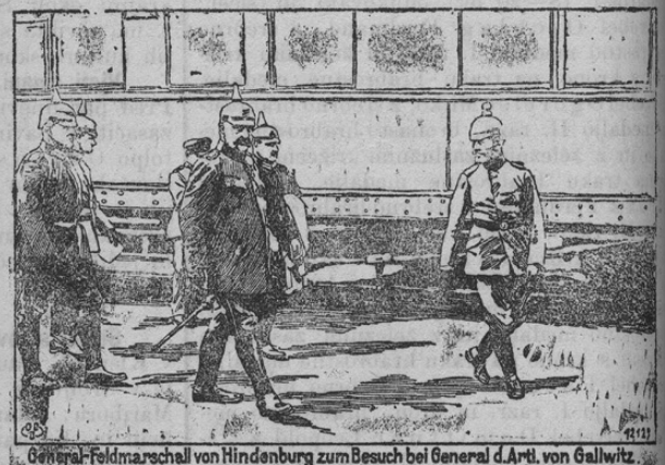
General-Feldmarschall von Hindenburg zum Besuch bei General d'Art. von Gallwitz.

Prinašamo sliko, ki nam kaže nemškega najznamenitejšega vojskovodje generalfeldmaršala v. Hindenburga, ko gre ravno na obisk generala artiljerije v. Gallwitza.