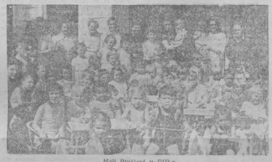
Mali Ptujčari v DID-u

Toplo je pri srcu danes vsakemu poštenemu in naprednemu človeku ki ima opravka z vzgojo mladine, pri zavesti, da ima končno priliko vzgajati zares svobodnega človeka, ker mu je nastajajoča nova družbena oblika dala sproščenost in ga rešila vseh tesnih vezi lažne morale gospodarjev stare Jugoslavije. Poleg tega ima vzgojitelj v naši socialistični državi pred seboj jasno perspektivo, ker ve, da bo edino način socialistične vzgoje dal pozitivne rezultate, — da bo namreč človek bodočnosti, ki ga bomo vzgojili v duhu načel marksizma-leninizma, svoboden, nesebičen, brez predsodkov, brez tendenc za izkoriščanje človeka po človeku.