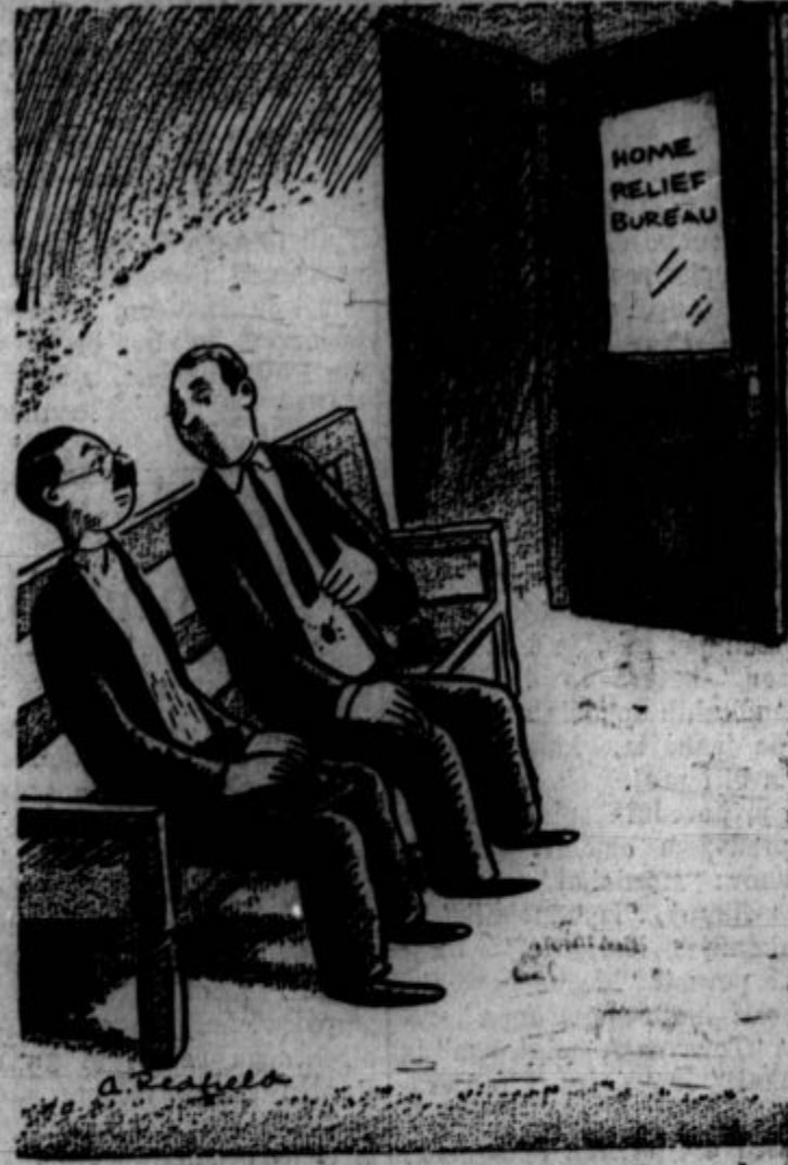
"Jaz sem član Phi Beta Kappe." "Tudi jaz se ne počutim dobro."