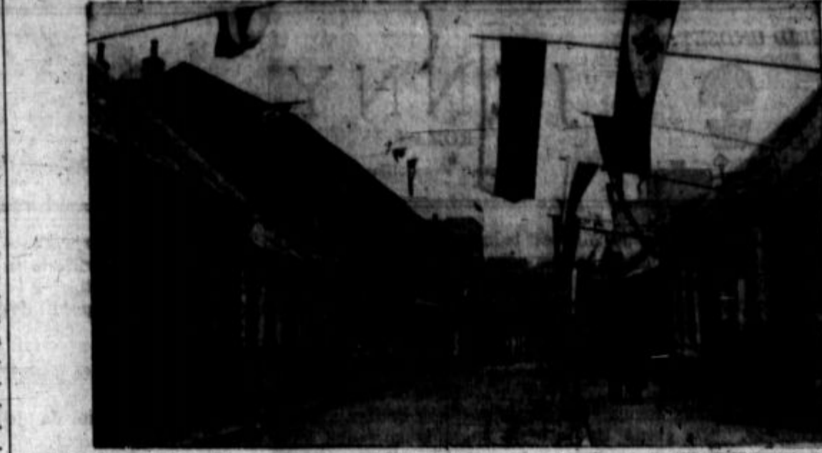
Svastika in slovaške zastave so vihrale v Bratislavi, glavnem mestu Slovačije, ko so se vrstile volitve poslancev.