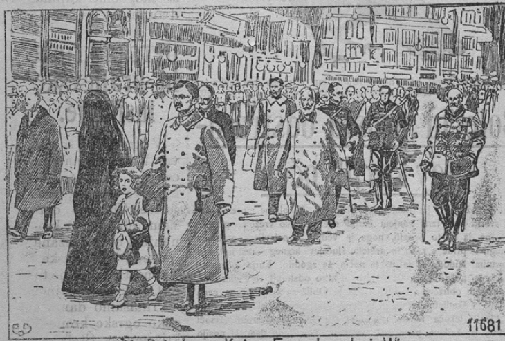
Die Beisetzung Kaiser Franz Josephs in Wien.

V predzadnji številki smo podali natančno poročilo o žalovnih priredbah ob priliki pogreba pokojnega našega cesarja Franc Jožefa. Čeprav par tednov pozneje, prinašamo danes eno sliko iz pogrebnih priredb. Naša slika kaže v ospredju novega cesarja Karla I. v spremstvu cesarice Čite; med njima pa koraka njuni sinček, sedanji naš prestolonaslednik. Za njima vidimo ostale vladarje prijateljskih držav in njihov zastopnike ter prestolonaslednike, ki so se pogreba udeležili. Žalovnega voza s cesarjevo krsto na naši sliki ni videti.