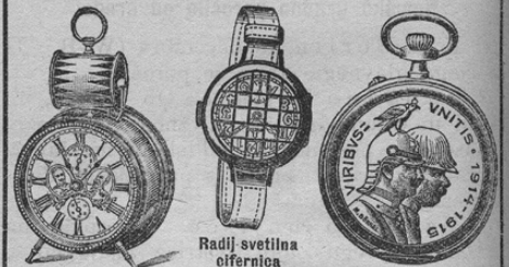
Radlj svetilna oifernica

Ure za napestnik z usnjatim jermenom, velika oblika K 8—, radium K 12—, ure za napestnik, mala oblika K 10—, 12—, radium 15—, 18—, s precizijskim anker-kolesjem K 24—, znamka Amalfa K 30—, Omega K 60—, radium K 10— več, z varstvom za steklo K 2— več. Vojna ura z dobrim anker-kolesjem K 6—, prima-kakovost K 10—, pravo srebro K 20—. Žepne ure-budilnice K 24—, radium K 32—. Vojna budilnica, zaniklana, 20 cm visoka K 8—, prima-kakovost K 10—. Budilnica „bobnar“ K 12—. Tri leta garancije. Se pošlje le proti pošiljati svote z K 1— za zavoj in poštnino franko po vsem Avstro-Ogrskem in na boljše po prvi za logi vojaških ur