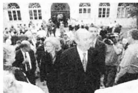
Dr. Andrej Bajuk in žena na ustanovnem zboru

Novoizvoljeni predsednik stranke Andrej Bajuk je v pogovoru z novinarji med drugim poudaril, da gre pri oblikovanju nove stranke na slovenskem političnem prizorišču za to, da se ustvari verodostojna, odprta stranka, ki bo ponudila opcijo slovenskim volilcem, ki se udeležujejo in prepoznajo na pomladanski strani. O sodelovanju novega političnega subjekta s SLS+SKD Slovensko ljudsko stranko je Bajuk, sicer pred izstopom nekdanji pod-