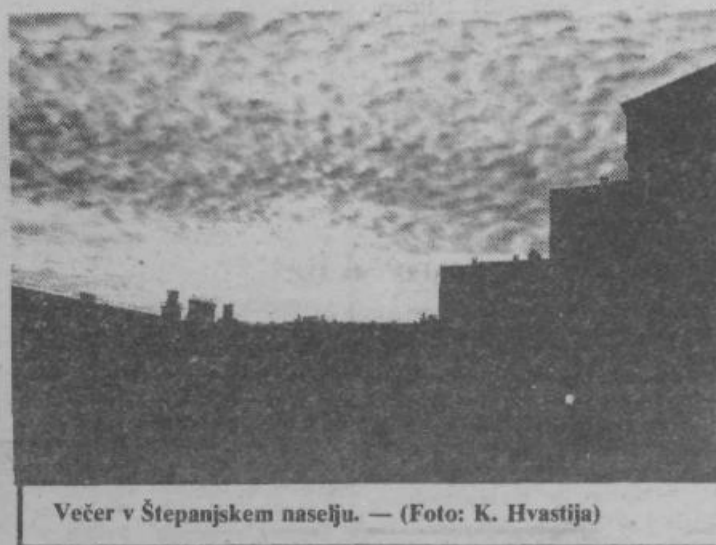
Večer v Štepanjskem naselju.