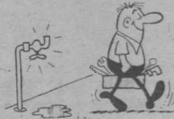
- Brez besed