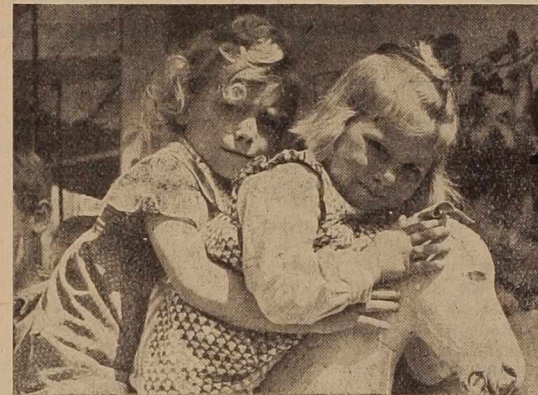
Kmal' bo pomlad prišla, rožce bo priklicala — in veselje. Zelja starih in mladih se že izpolnjuje. Kar pogledite jih, dve sestrici, kako sta pod toplim pomladanskim soncem razigrani na svojem konjičku.

Uredništvo je najprej izbralo zelo primerno in prikupno zunanjo obliko: žepni format. Resda spominja nekoliko na številne magazine, ki jih drugod tako radi berejo na