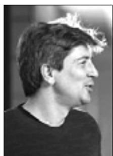
Nobelovec Edvard Moser

Na včerajšnji novinarski konferenci so predstavili, kaj se obeta na večdnevnem srečanju, ki bo potekalo na Velikem trgu ter v bližnji deželni palači, spremljevalni dogodki pa bodo tudi na drugih prizoriščih na različnih koncih mesta. Organizatorji; Občina Trst, Univerza v Trstu, Venezia-Post, vse