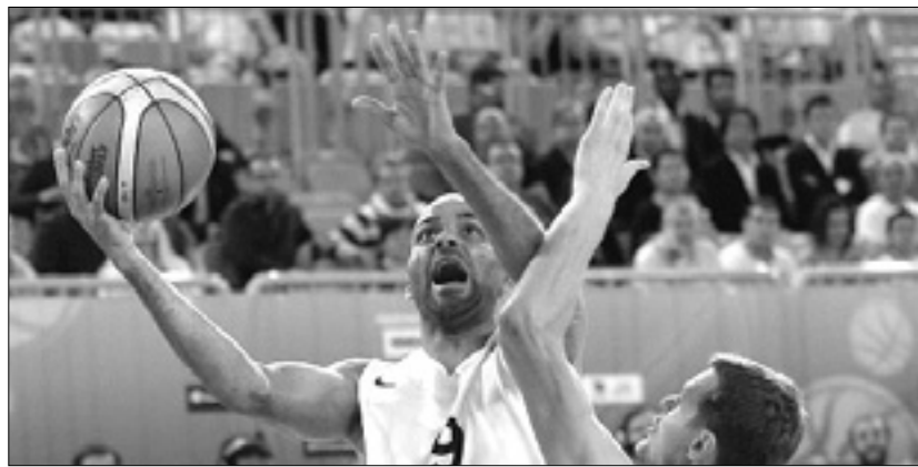
Najboljši strelec Francije je bil Tony Parker (18 točk)

V sredozemskem derbiju Španija boljša od Grčije - Francija brez večjih težav