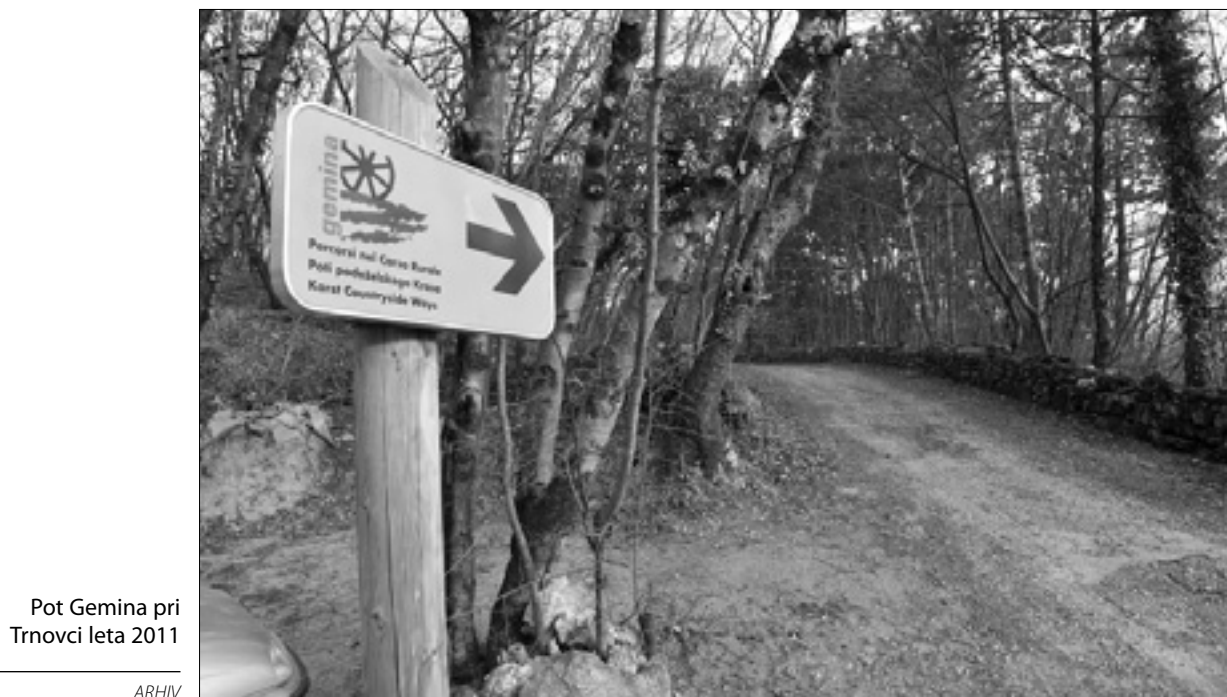
Pot Gemina pri Trnovci leta 2011

»Upam, da bodo sedaj vsi zadovoljni,« je dodal Dolenc, ki ocenjuje, da so dvignili veliko prahu za nič. Razpis je torej objavljen, vsak se lahko prijavi in sodeluje pri upravljanju dela poti v domeni seveda s teritorijem oz. lastniki posameznih odsekov. »Ko bi bilo več dialoga, bi se stvari dalo rešiti drugače. Tako ustvarjamo samo nepotrebno slabo kri.« (sas)