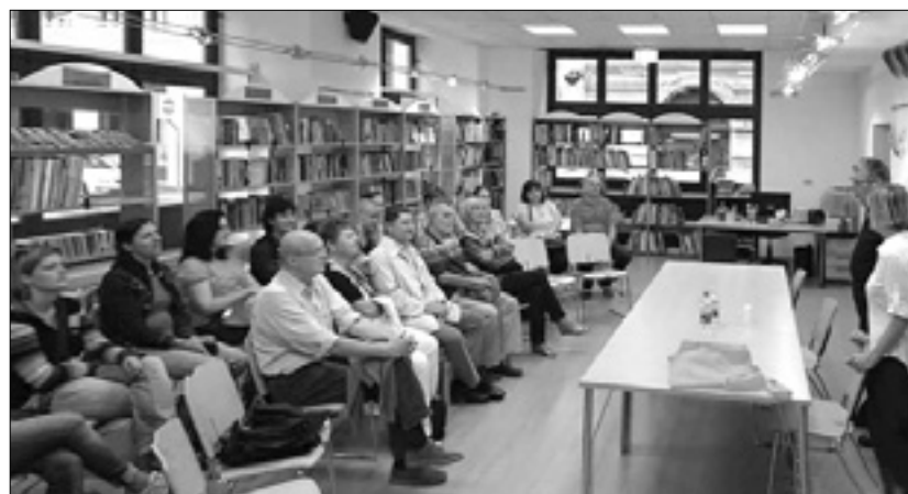
Kolektiv Andragoškega centra Slovenije na obisku

Ogled Narodnega doma in predstavitev Slorijevih projektov, ki zadevajo področje izobraževanja odraslih