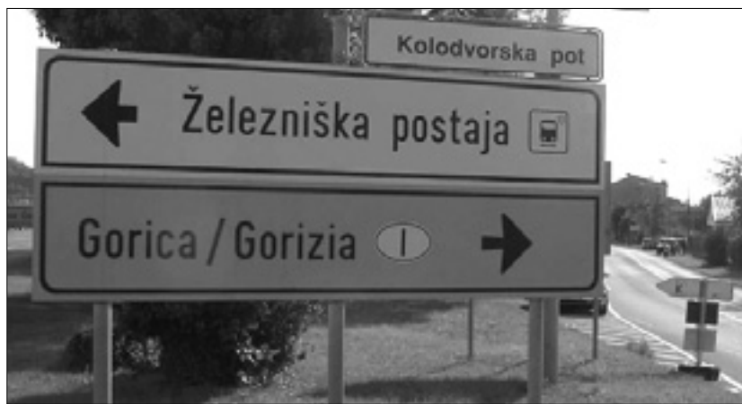
Kažipot v Solkanu (zgoraj), smerokazi Na Goriščku (spodaj)