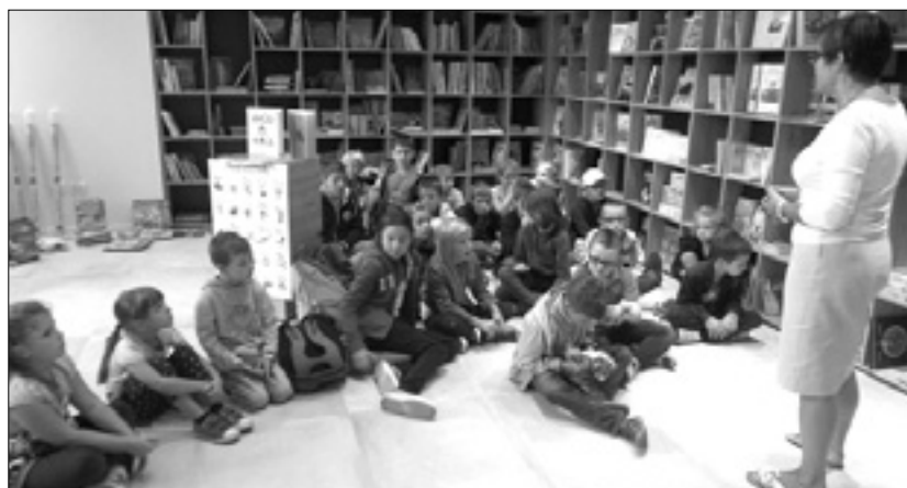
Obisk v Tržaškem knjižnem središču