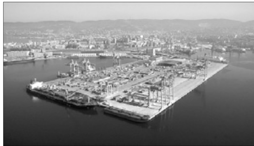
Sedmi pomol v tržaškem novem pristanišču

Dan odprtih vrat tržaškega pristanišča bo potekal v nedeljo in sicer od 10. ure dalje. Občani bodo pred Železniškim muzejem pri Sv. Andreju stopili na avtobuse, ti pa jih bodo popeljali med pristaniške terminale. Obiskovalce bodo tu sprejeli pristaniški delavci in jim prikazali razno razne dejavnosti ter objekte. Ogled pristanišča je seveda brezplačen, traja pa približno dve uri. Povpraševanja je res veliko, tako da je še malo mest na razpolago. Prijavite se lahko na spletni strani www.porto.trieste.it ali pa na telefonski številki 340-7546609. (RD)