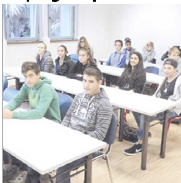
Prvi razred kuharske šole