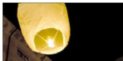
Papirnata laterna kitajske izdelave

Kitajskih trgovin je v zadnjih časih tudi v naših krajih vse več. V skoraj vsaki izmed njih je mogoče kupiti papirnate laterne. Narejene so iz nezgorljivega papirja, letijo pa, dokler jih poganja plamen, kakor aerostatični baloni. Ko ogenj ugasne, po 8-10 minutah, naj bi se nenevarno spustile na zemljo. Ponekod po Italiji so jih iz previdnosti vsekakor prepovedali, saj ogrožajo letalski promet. Ravno zaradi tega je uprava ronškega letališča v zadnjih dneh pisala pismo vsem bližnjim občinam, tako da ga bodo prejeli v Ronkah, Tržiču, Štarancanu, Foljanu-Redipulji, Škocjanu, Gradišču, Romansu, Vilešu, Turjaku, San Pieru, Zagraju, Fari, Vilešu, Sovodnjah, Marianu, Červinjanu, Fiumicellu, Villi Vicentini, Ogleju in še v nekaterih občinah na Videmskem. Uprava letališča v pismu opozarja, da je leta 2012 na rimskem letališču Boeing 737/800 moral prekiniti vzlet, ker je eden izmed motorjev vsrkal laterno. Iz Ronk tudi poudarjajo, da so doslej na območju letališča našli že 22 papirnatih latern, ki so tja priletele iz najrazličnejših krajev. Za spuščanje latern v zrak je sicer treba imeti posebno dovoljenje; kdor ga nima, tvega globo 103 evrov.