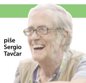
piše Sergio Tavčar

D-LIGA - Danes ob 15.00 v Trstu, Rocco Triestina - Noale. B-LIGA - Zaostala tekma: Ascoli - Entella 1:0.