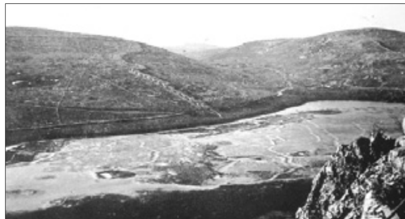
Doberdobsko jezero leta 1916 (zgoraj) in v današnjem času (spodaj)