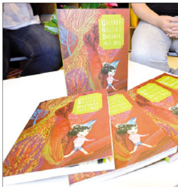
Levo Galebov šolski dnevnik; desno predstavitev v Tržaškem knjižnem središču