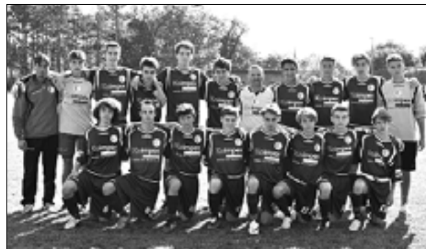
Deželni naraščajniki Krasa na igrišču v Trebčah