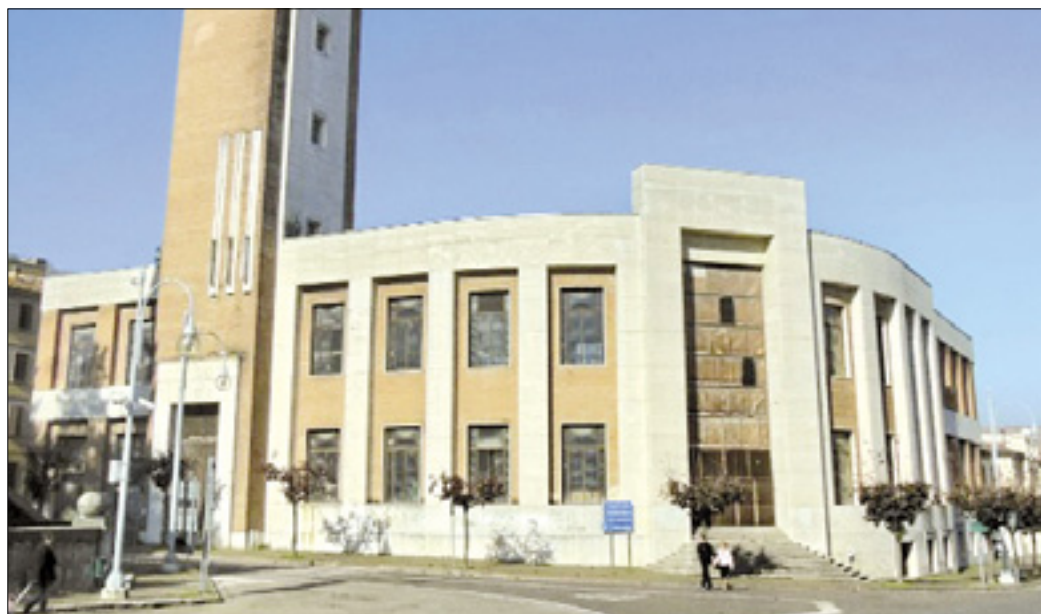
Nekdanja Casa del fascio v Predappiu, zgrajena v fašističnem slogu, kjer načrtujejo muzej fašizma