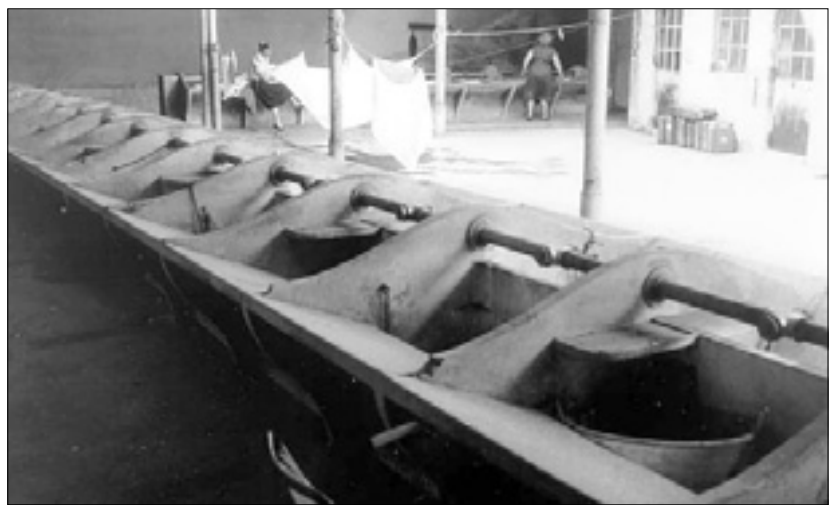
Fotografski posnetek nekdanje pralnice pri Sv. Jakobu

Nekdanja javna pralnica pri Svetem Jakobu (Ul. San Giacomo in monte 9) bo jutri ob 20. uri gostila recital z naslovom »paroledidonne« (besede žena). Recital je sicer najbližji naziv posebne predstave, ki jo sestavljajo teksti številnih avtoric različnih zgodovinskih obdobij, med temi tudi sodobne pesnice Alda Merini. Predstava bo razdeljena v tri poglavja: Ženske, Izseljevanja, Dnevnik, ki bo do bogaten z glasbenimi točkami in razlagami tekstov.