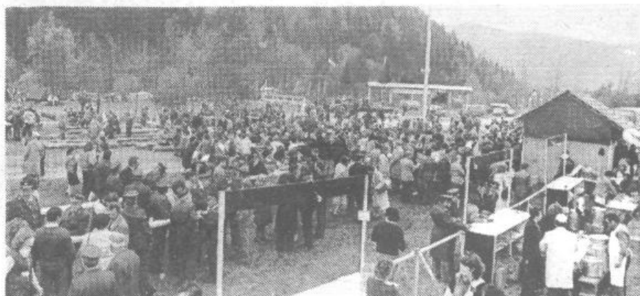
Praznovanja ni motilo tudi nekoliko hladnejše vreme, saj so gostitelji poskrbeli domala za popolno gostoljubje številnih udeležencev