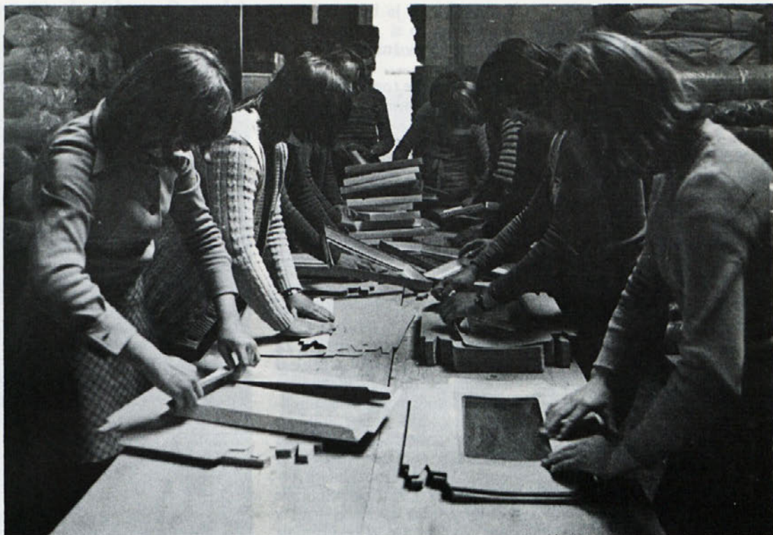
Prvi stik z našim proizvodnim programom dobijo mladi, ki pridejo k nam na prakso ob enostavnejših delih, sledijo pa jim zahtevnejša.

S sprejetjem zakona o usmerjenem izobraževanju je dejansko uzakonjena višja raven splošne izobrazbe za vse učence, ki bodo nadaljevali šolanje po osnovni šoli. V prvih dveh letih izobraževanja, v času tako imenovane skupne vzgojnoizobraževalne osnove, naj bi vsi učenci pridobili približno enaka splošna znanja (75 % splošno izobraževalnih predmetov) ter del strokovnih znanj glede na