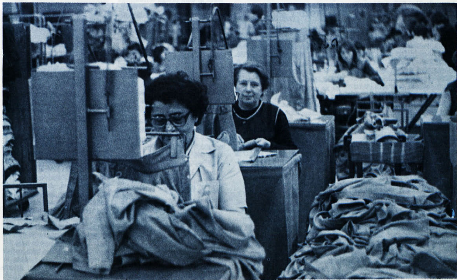
Še malo, pa bodo tudi delavci TOZD DELTE odšli na dopust. Tistim, ki te dni preživljate svoj oddih in tistim, ki se nanj šele pripravljate, želimo prijetne in lepe proste dni!