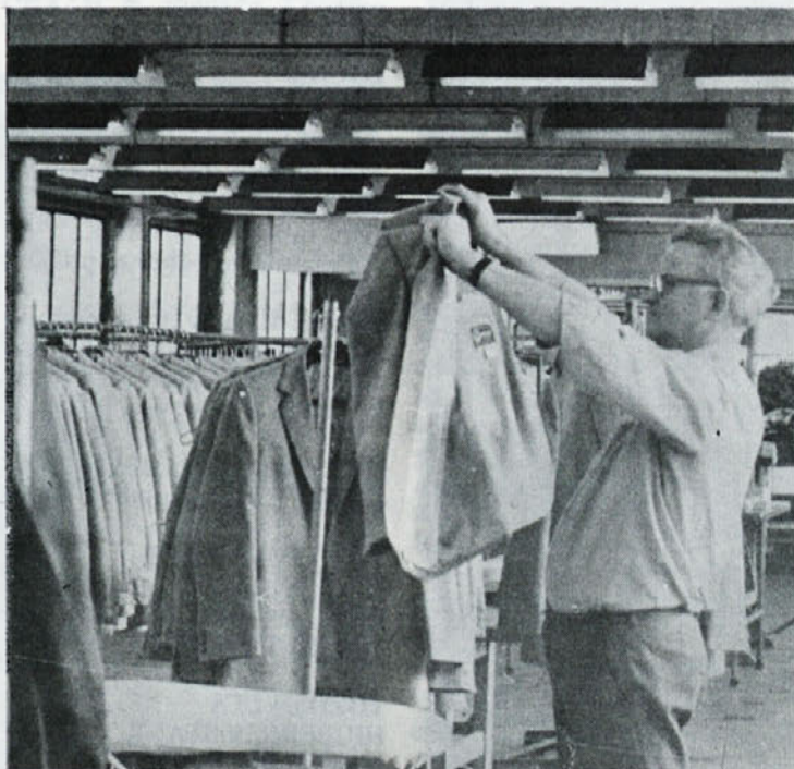
Še zadnji pogled predno bo izdelek zapustil TOZD TEMENICO in odpotoval na vse bolj zahtevni trg.