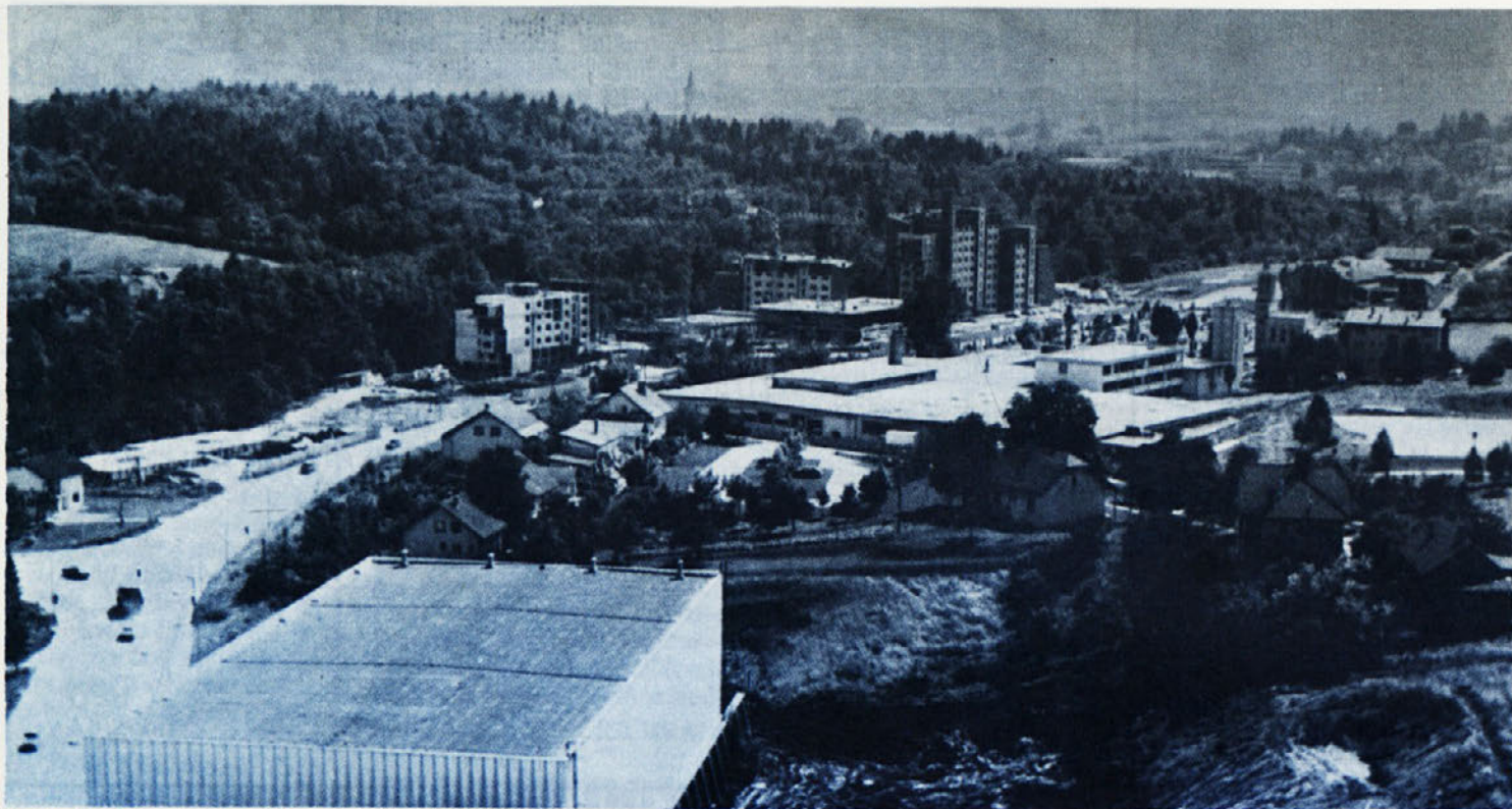
Pogled iz 60 meterske višine na ločenski del Novega mesta, kjer nasproti Laboda raste novo stanovanjsko naselje.